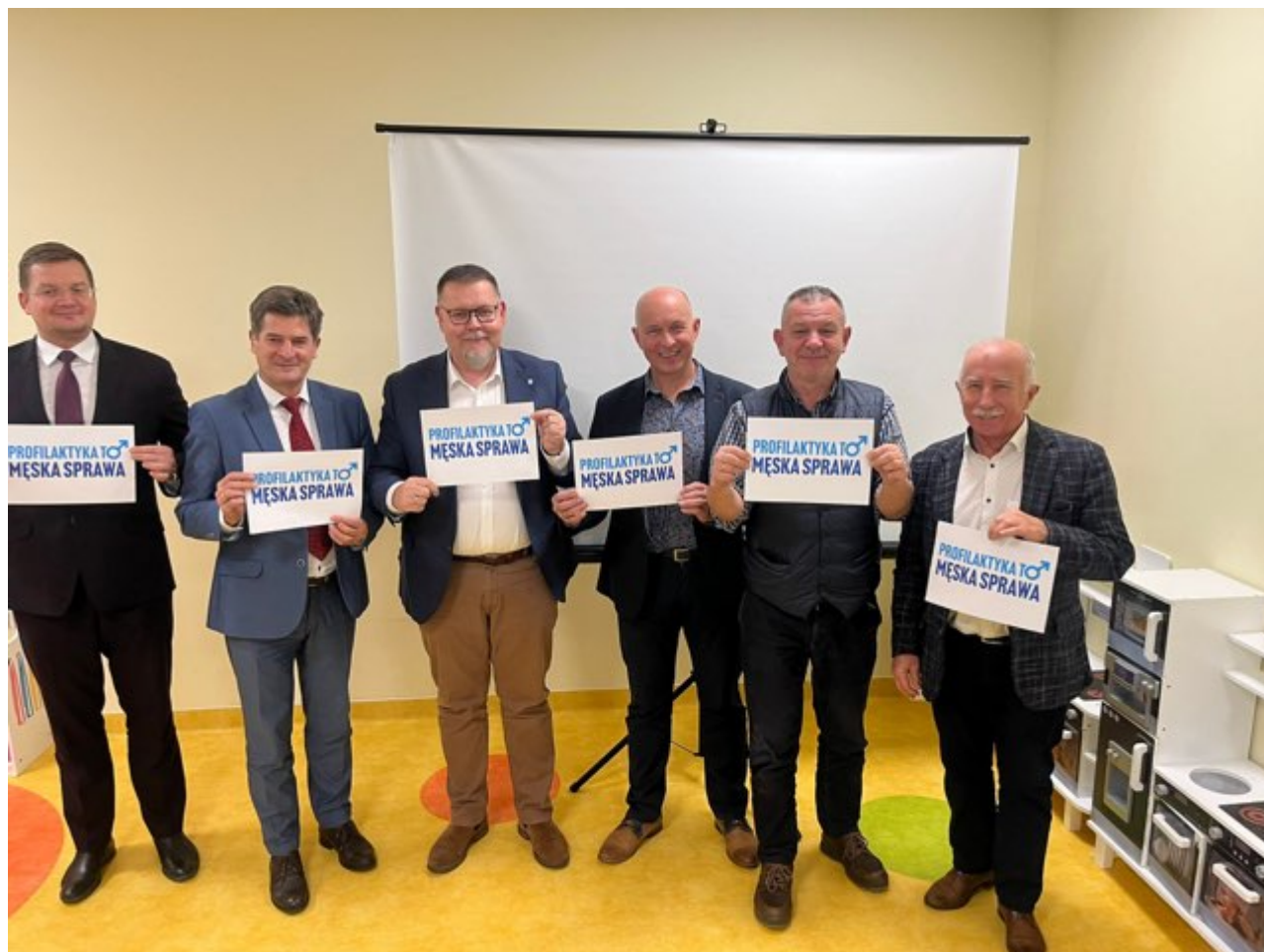
zdjęcie przedstawicieli administracji samorządowej w mieście Rzeszów wspierających akcje "Profilaktyka to męska sprawa"