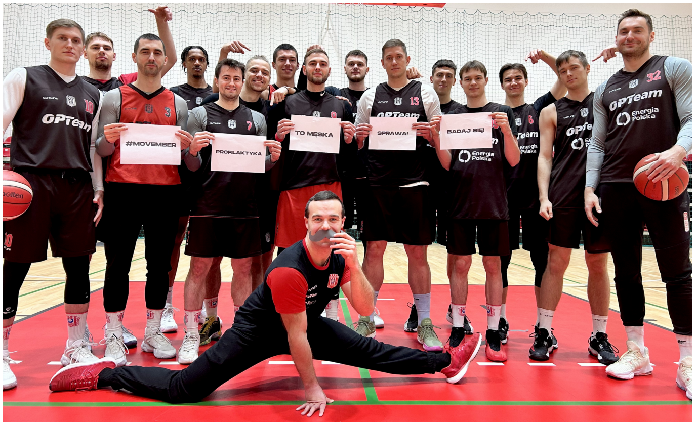
zdjęcie drużyny koszykarskiej OPlTeam Energia Polska Resovia Rzeszów wspierającej akcję "Profilaktyka to męska sprawa"