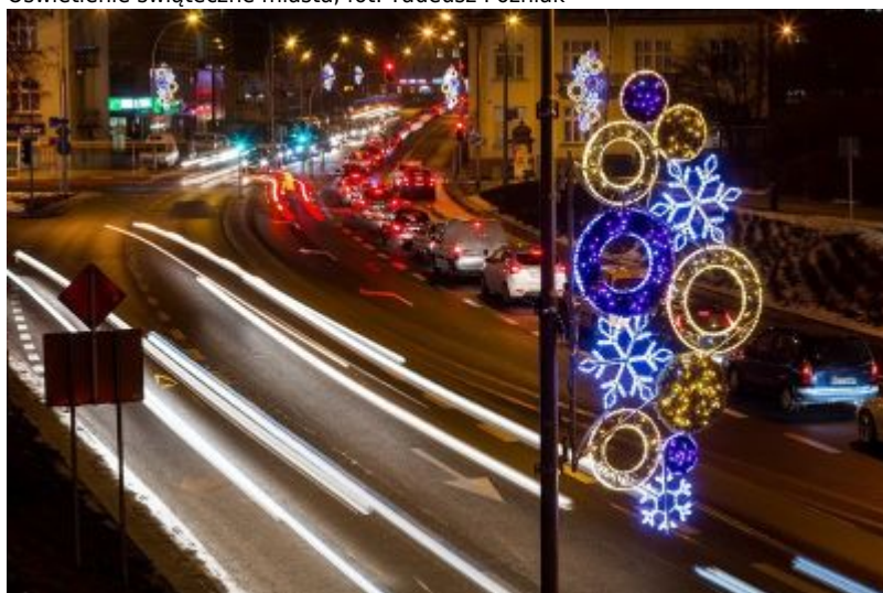
Oświetlenie świąteczne miasta