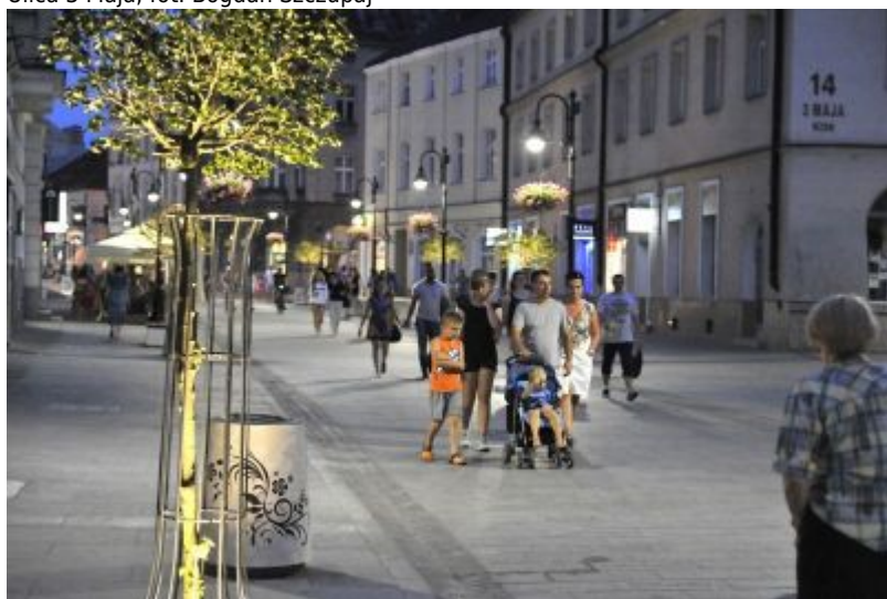
Ulica 3 Maja