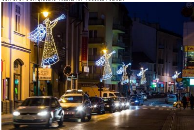
Oświetlenie świąteczne miasta, fot. Tadeusz Pożniak