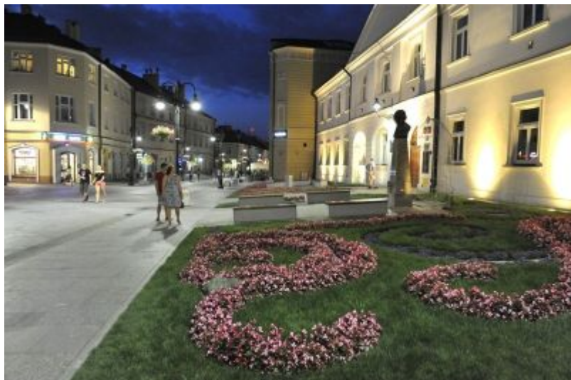
Ulica 3 Maja