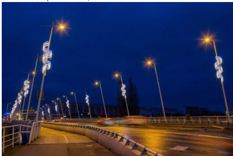
Oświetlenie świąteczne miasta