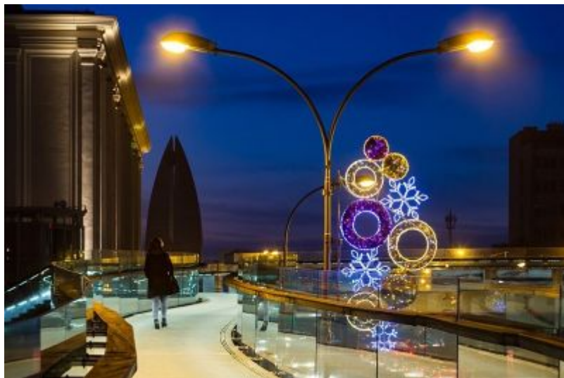
Oświetlenie świąteczne miasta