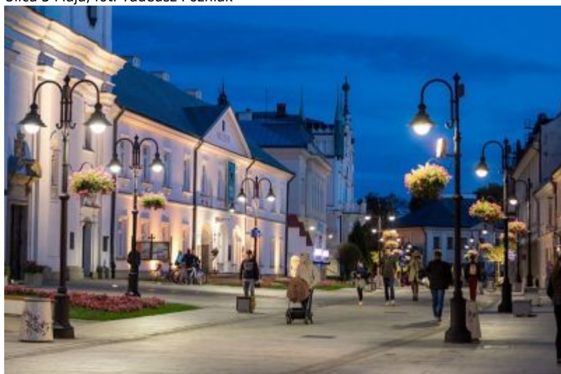
Ulica 3 Maja