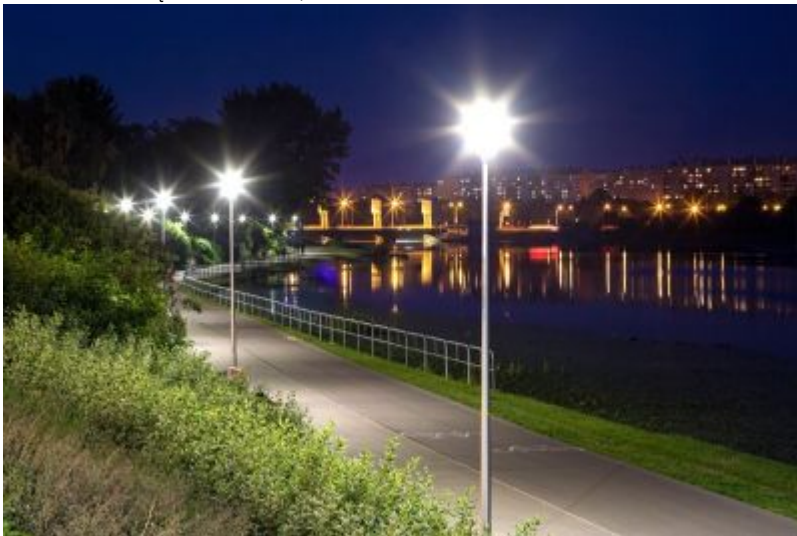
Promenada nad Wisłokiem od mostu Karpackiego w kierunku Lisiej Góry