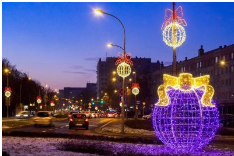
Oświetlenie świąteczne miasta