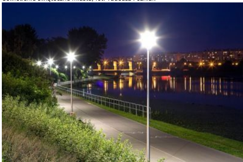
Promenada nad Wisłokiem od mostu Karpackiego w kierunku Lisiej Góry