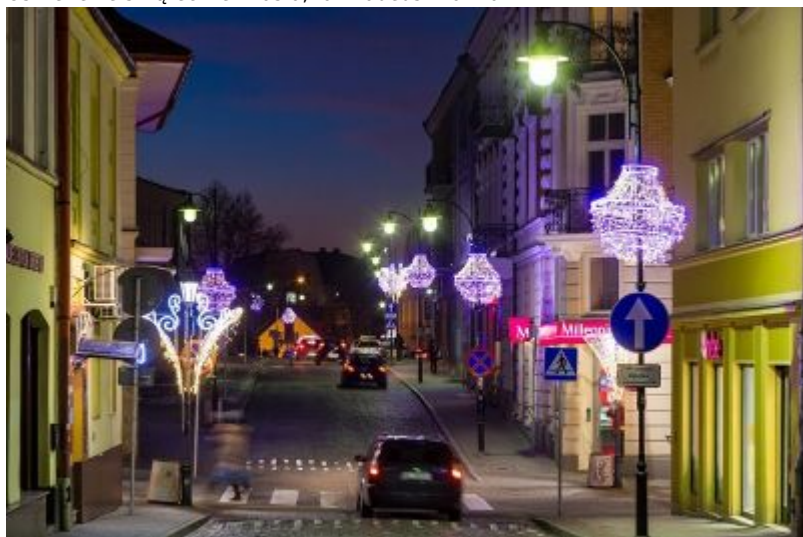
Oświetlenie świąteczne miasta