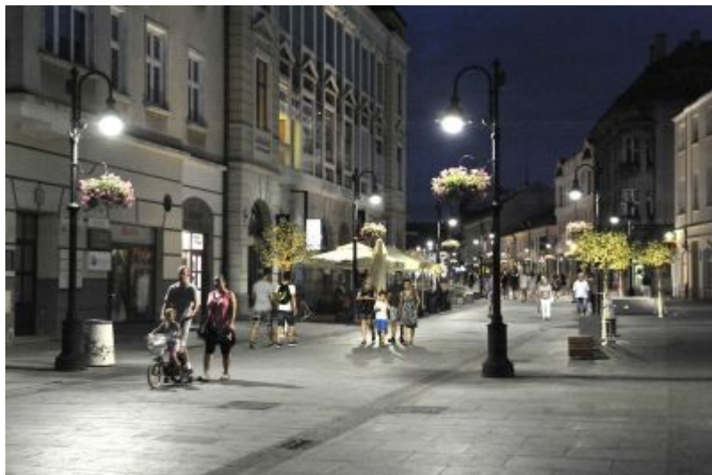
Ulica 3 Maja, fot. Bogdan Szczupaj