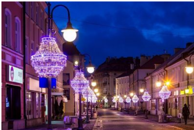
Ulica 3 Maja