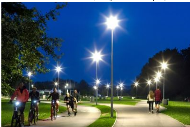
Promenada nad Wisłokiem od mostu Karpackiego w kierunku Lisiej Góry

Komisja Konkursu na „Najlepiej oświetloną gminę i miasto 2017 roku” i „Najlepszą inwestycję oświetleniową 2017 roku” przyznała dla Rzeszowa nagrody za wykonanie inwestycji oświetleniowych: