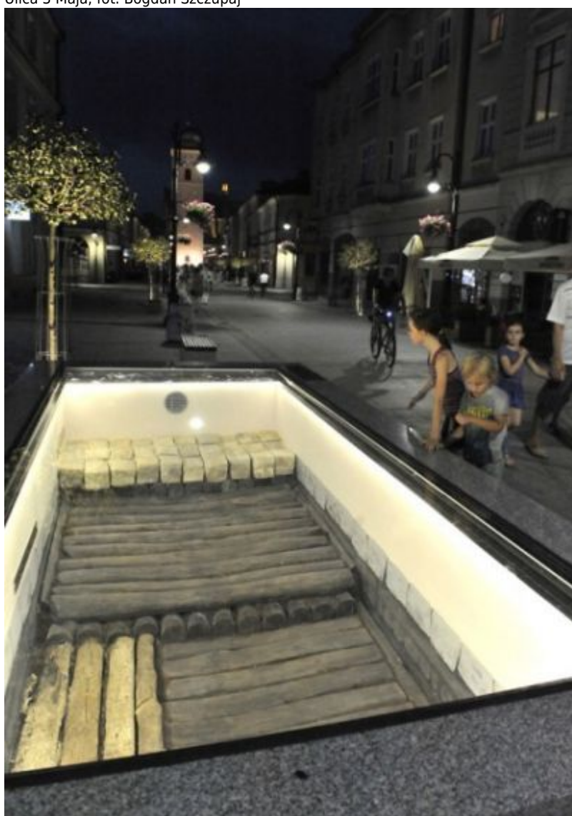
Ulica 3 Maja