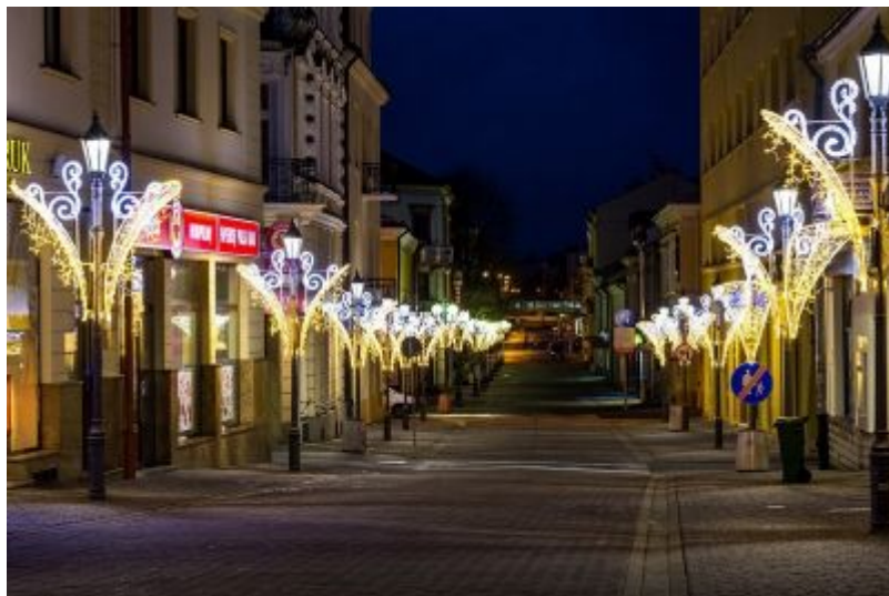
Oświetlenie świąteczne miasta