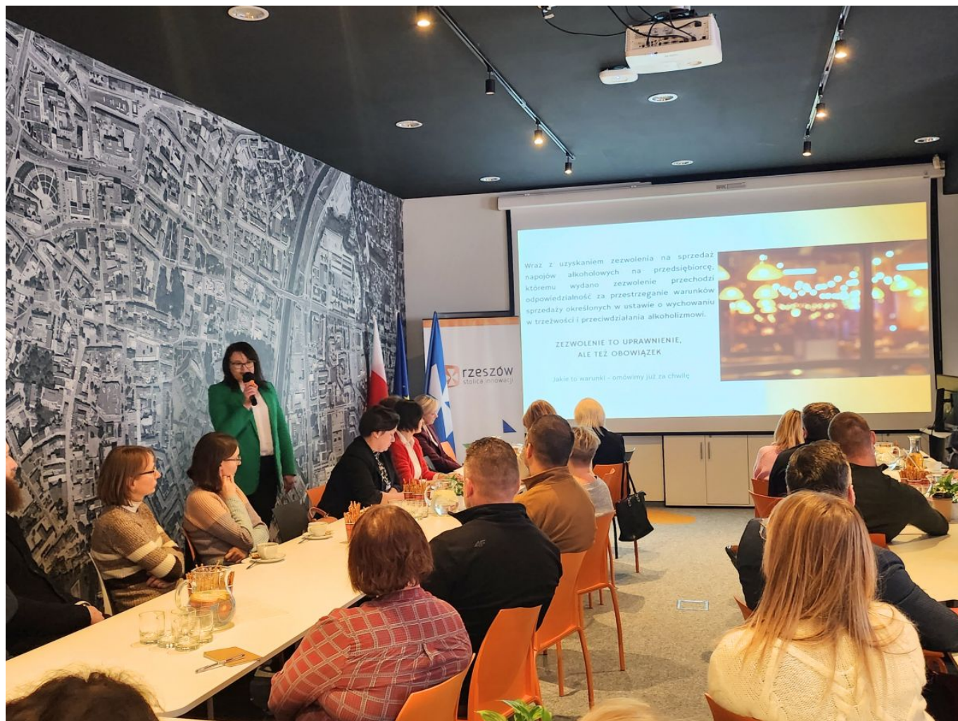
zdjęcie ze szkolenia z przedsiębiorcami na terenie miasta Rzeszowa