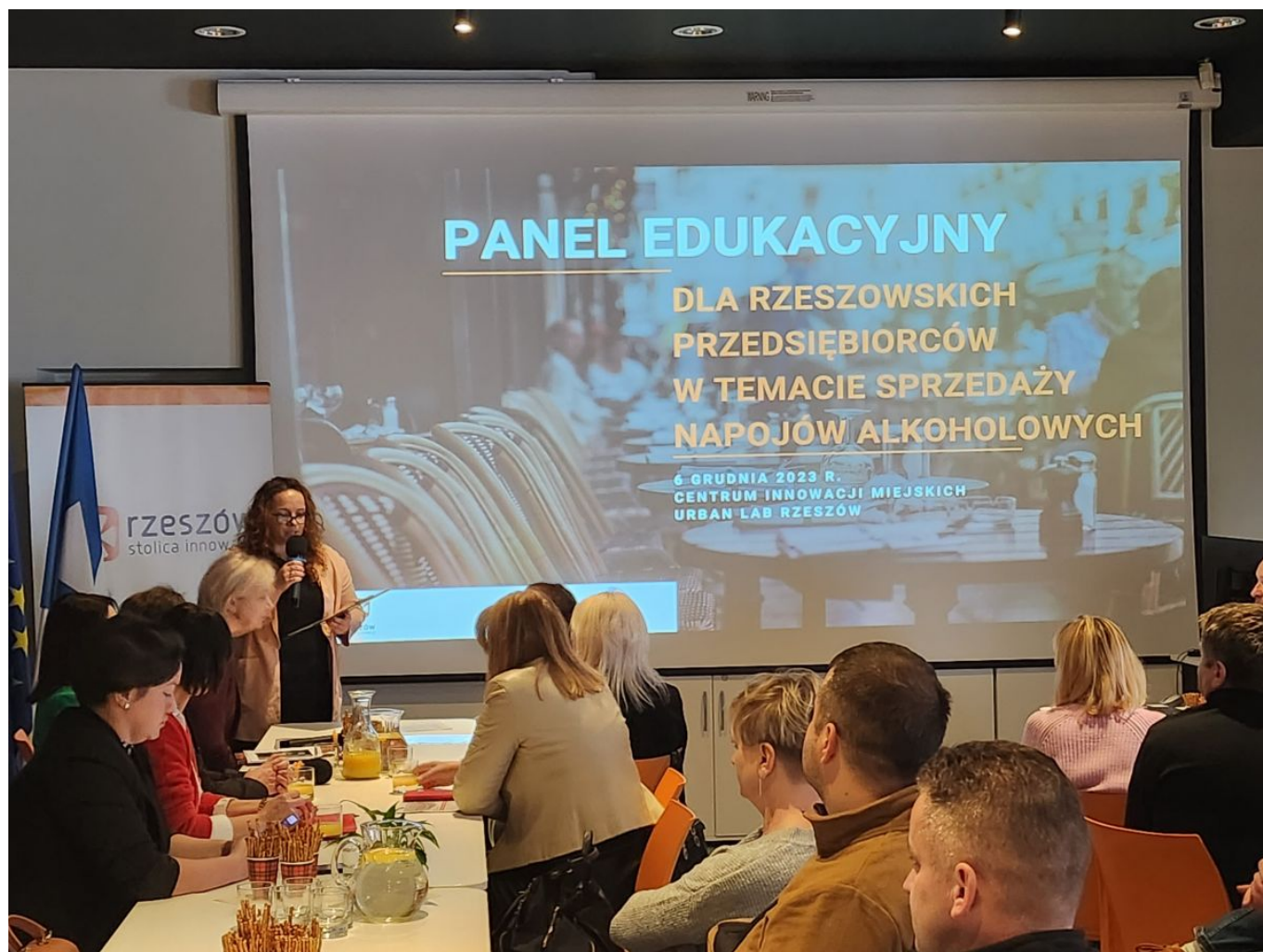
zdjęcie ze szkolenia z przedsiębiorcami na terenie miasta Rzeszowa