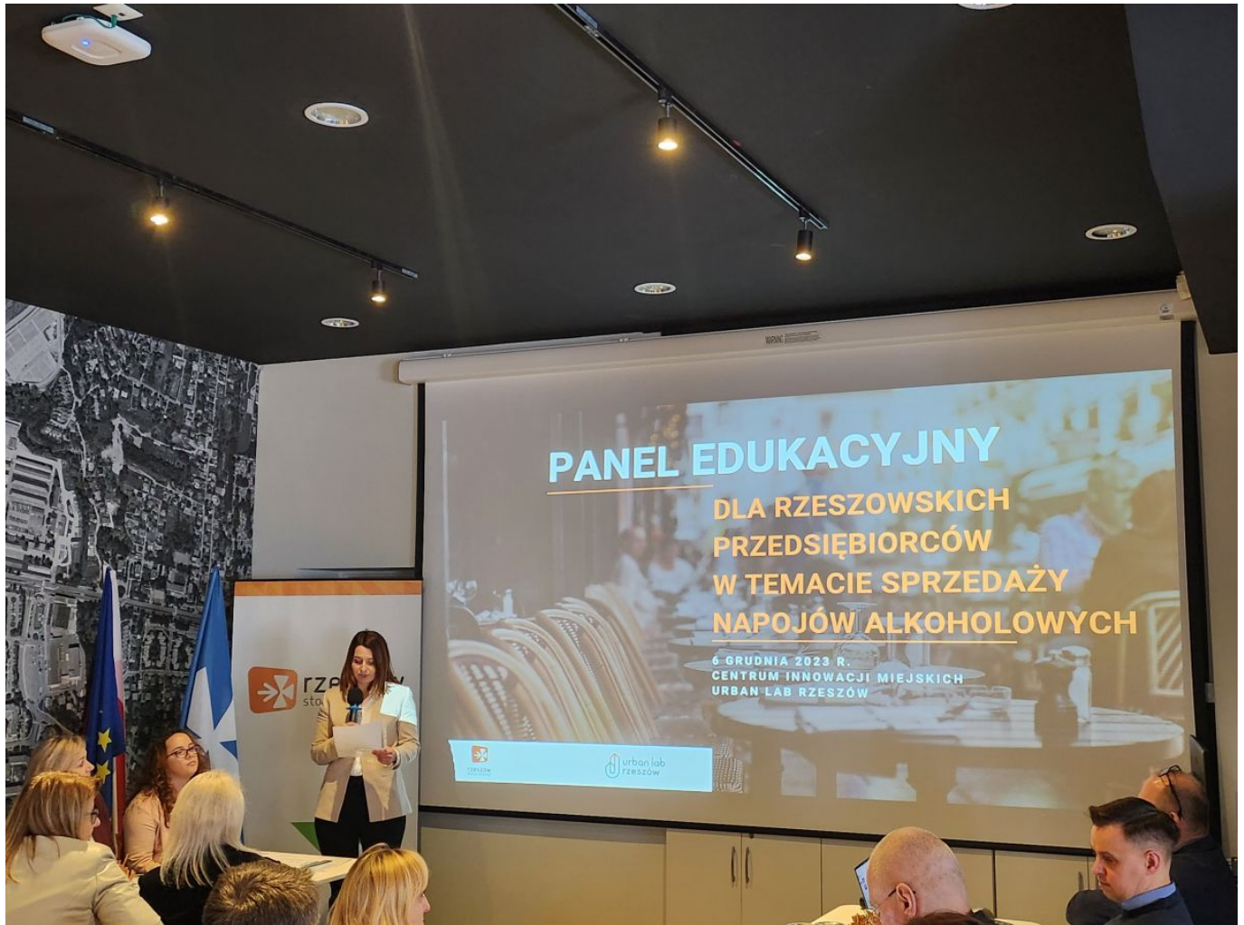
zdjęcie ze szkolenia z przedsiębiorcami na terenie miasta Rzeszowa