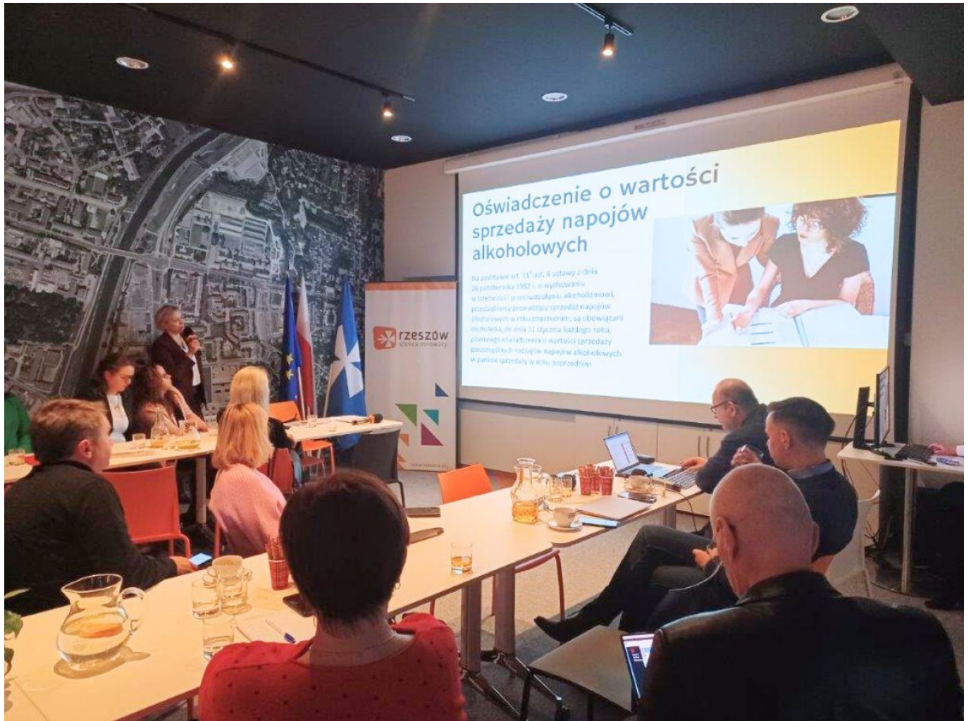
zdjęcie ze szkolenia z przedsiębiorcami na terenie miasta Rzeszowa