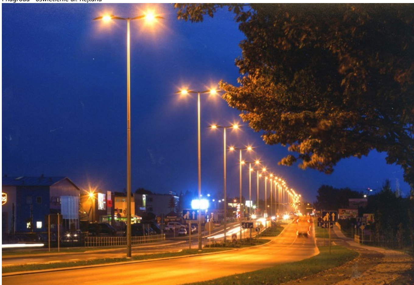
I nagroda - oświetlenie ul. Lubelskiej