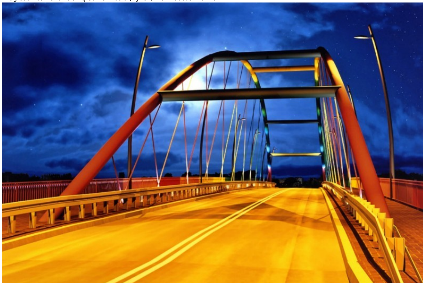
II nagroda - oświetlenie Mostu Narutowicza

Komisja Konkursowa Konkursu „Najlepiej oświetlona gmina i miasto 2014 roku” i „Najlepsza inwestycja oświetleniowa 2014 roku” przyznała Urzędowi Miasta Rzeszowa I Nagrodę za oświetlenie drogowe wykonane w ramach rozbudowy alei Rejtana i ulicy Lubelskiej oraz oświetlenie świąteczne miasta.