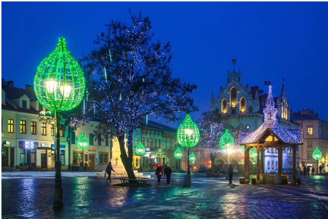
I nagroda - oświetlenie świąteczne miasta (Rynek)