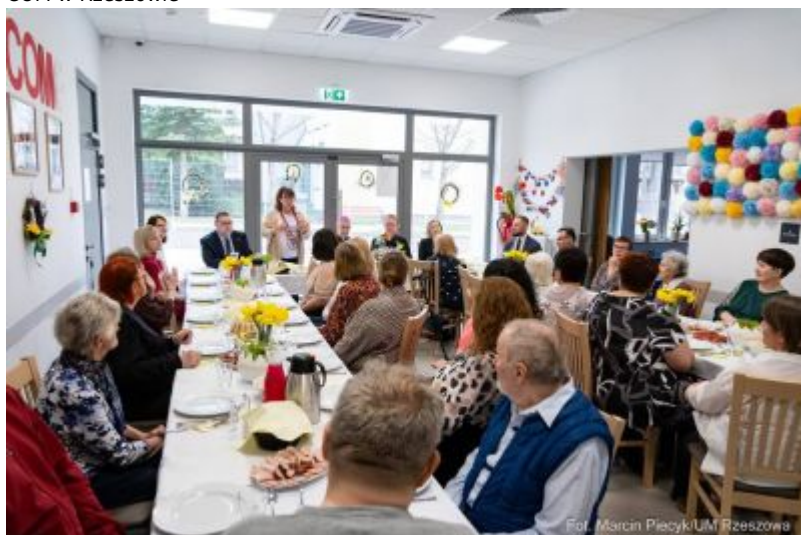
COM w Rzeszowie