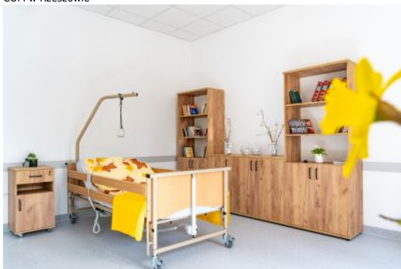
COM w Rzeszowie