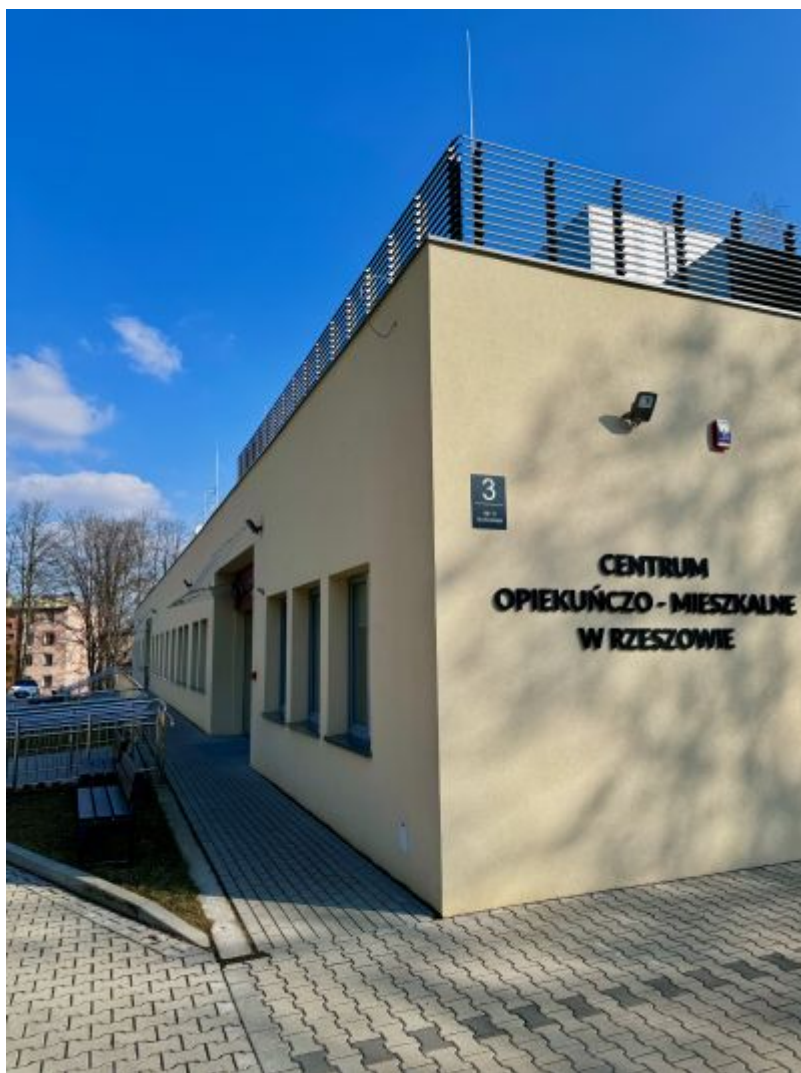
COM w Rzeszowie