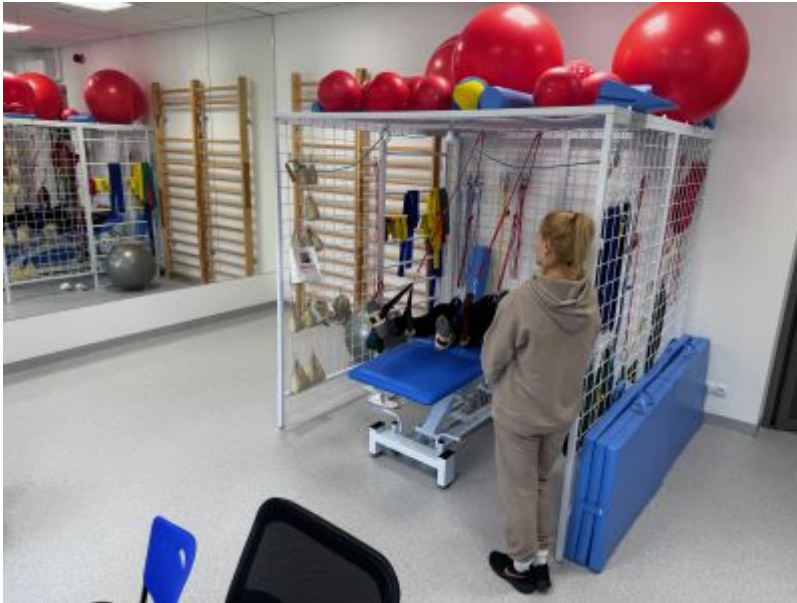
COM w Rzeszowie