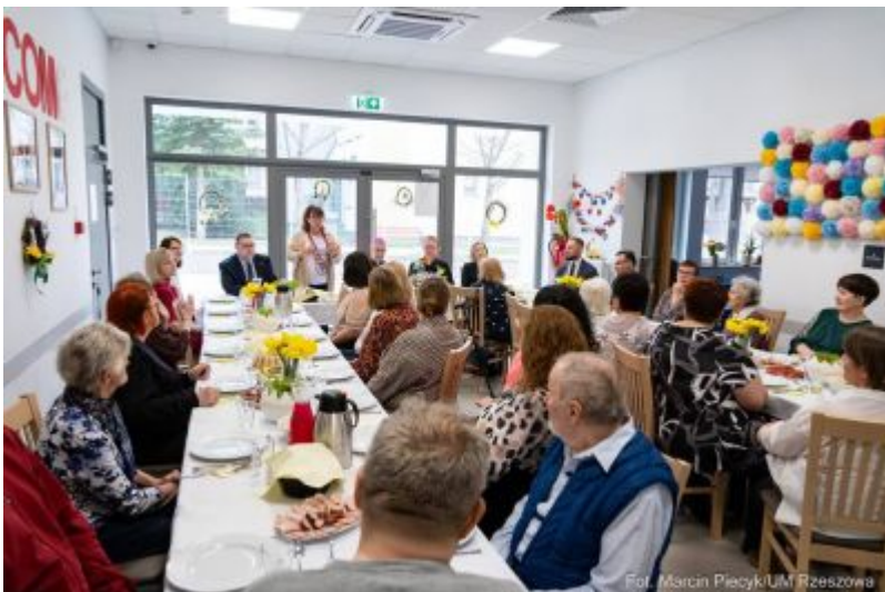
COM w Rzeszowie