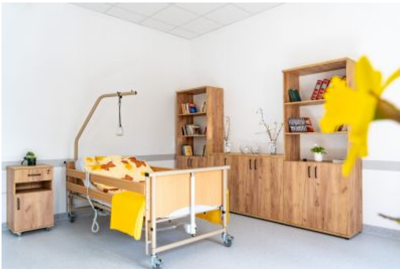
COM w Rzeszowie