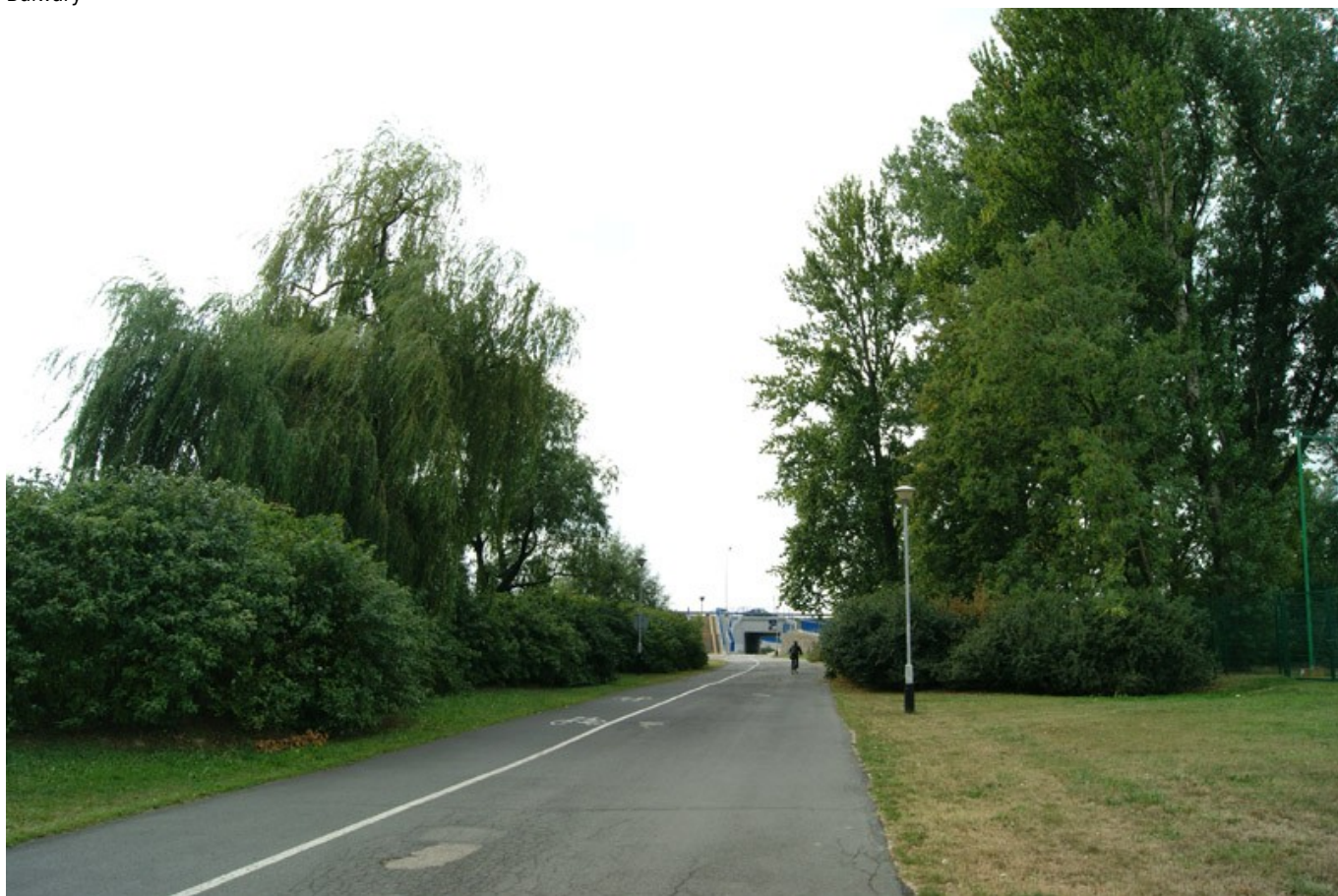
Wierzby na skarpie przy Stadionie Miejskim

Po drodze mijamy nowoczesny dirtpark oddany do użytku w 2014 roku, topole i jesiony wyniosłego, dochodzimy do Parku Kultury i Wypoczynku, gdzie w maju wyjątkowo pięknie prezentuje się szpaler głogów dwuszyjkowych - odmiana pełnokwiatowa czerwona oraz dąb czerwony, po lewej stronie mijamy szpaler jesionów. Natomiast na łące rośnie lipa srebrzysta, bodziszek łąkowy i inne.