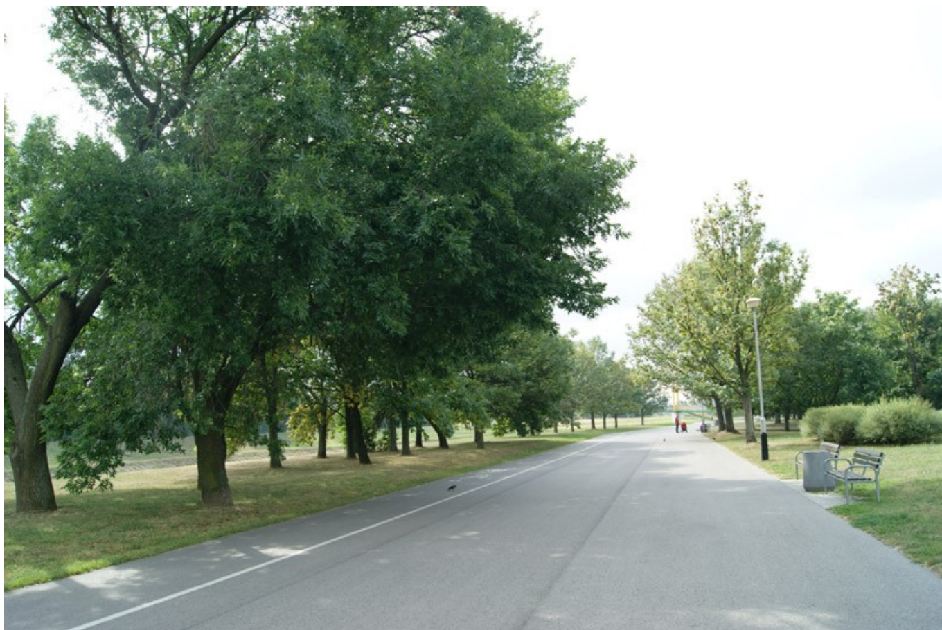
Ścieżka rowerowa w kierunku Lisiej Góry