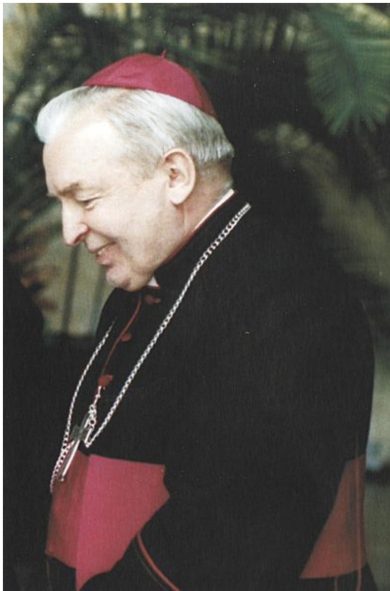
Ksiądz Biskup Kazimierz Górny