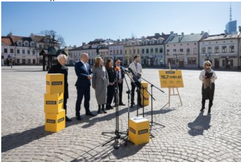
Rzeszowski Budżet Obywatelski, fot. Grzegorz Bukała, Urząd Miasta Rzeszowa

Ruszył nabór projektów, czekamy na Wasze propozycje do 29 marca!