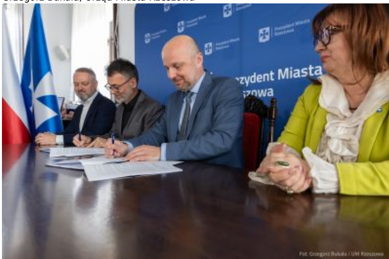
zdjęcie z podpisania umowy z firmą ABM Architektura Nieruchomości z Gliwic - wykonawcą szkoły na osiedlu Budziwój w Rzeszowie, fot. Grzegorz Bukała, Urząd Miasta Rzeszowa

Na rzeszowskim osiedlu Budziwój powstanie nowy budynek szkoły, w którym będzie mogło się uczyć aż 670 dzieci. Oprócz sal lekcyjnych będzie tam, także hala sportowa z trybunami, kuchnia z zapleczem i jadalnią, świetlice, mała sala gimnastyczna do zajęć fitness, siłownia.