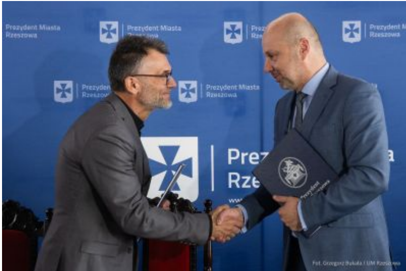
zdjęcie z podpisania umowy z firmą ABM Architektura Nieruchomości z Gliwic - wykonawcą szkoły na osiedlu Budziwój w Rzeszowie