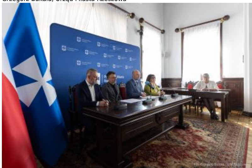
zdjęcie z podpisania umowy z firmą ABM Architektura Nieruchomości z Gliwic - wykonawcą szkoły na osiedlu Budziwój w Rzeszowie, fot. Grzegorz Bukała, Urząd Miasta Rzeszowa