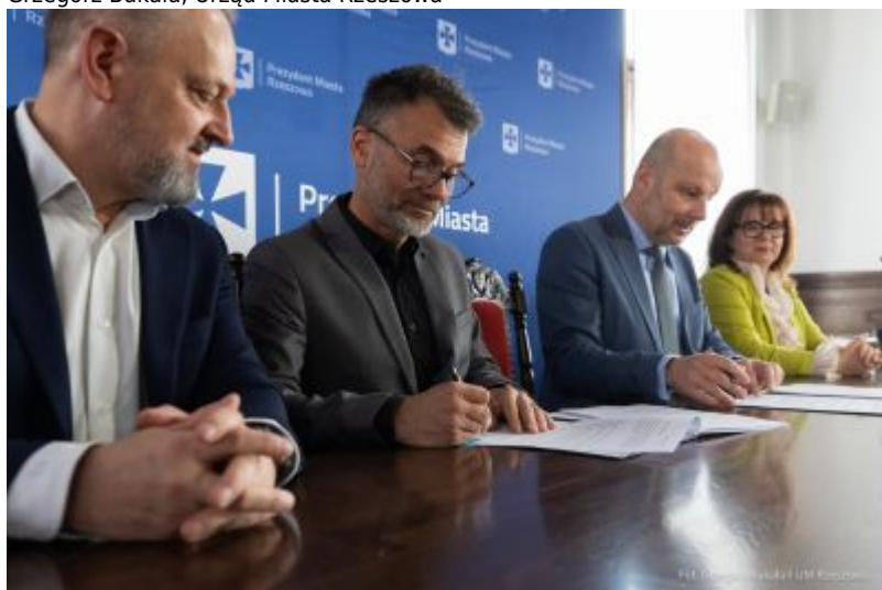
zdjęcie z podpisania umowy z firmą ABM Architektura Nieruchomości z Gliwic - wykonawcą szkoły na osiedlu Budziwój w Rzeszowie, fot. Grzegorz Bukała, Urząd Miasta Rzeszowa