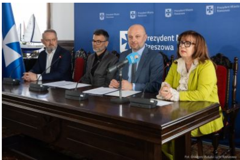
zdjęcie z podpisania umowy z firmą ABM Architektura Nieruchomości z Gliwic - wykonawcą szkoły na osiedlu Budziwój w Rzeszowie