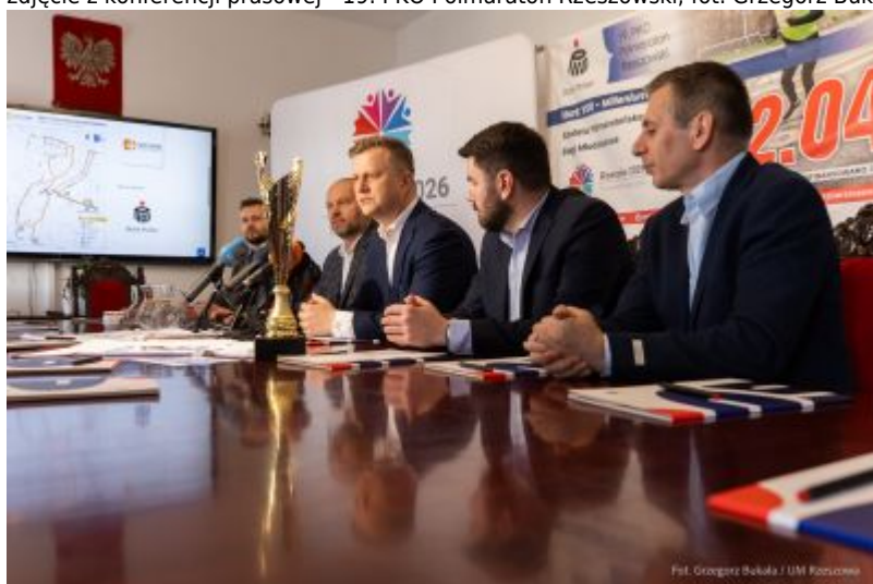
zdjęcie z konferencji prasowej - 19. PKO Półmaraton Rzeszowski