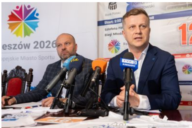
zdjęcie z konferencji prasowej - 19. PKO Półmaraton Rzeszowski, fot. Grzegorz Bukala, Urząd Miasta Rzeszowa