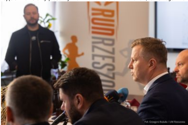
zdjęcie z konferencji prasowej - 19. PKO Półmaraton Rzeszowski