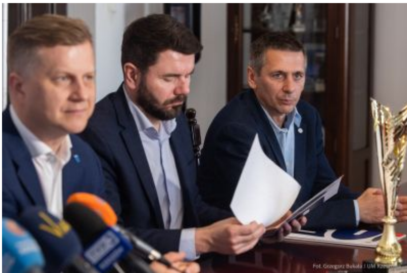
zdjęcie z konferencji prasowej - 19. PKO Półmaraton Rzeszowski