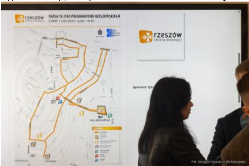
zdjęcie z konferencji prasowej - 19. PKO Półmaraton Rzeszowski