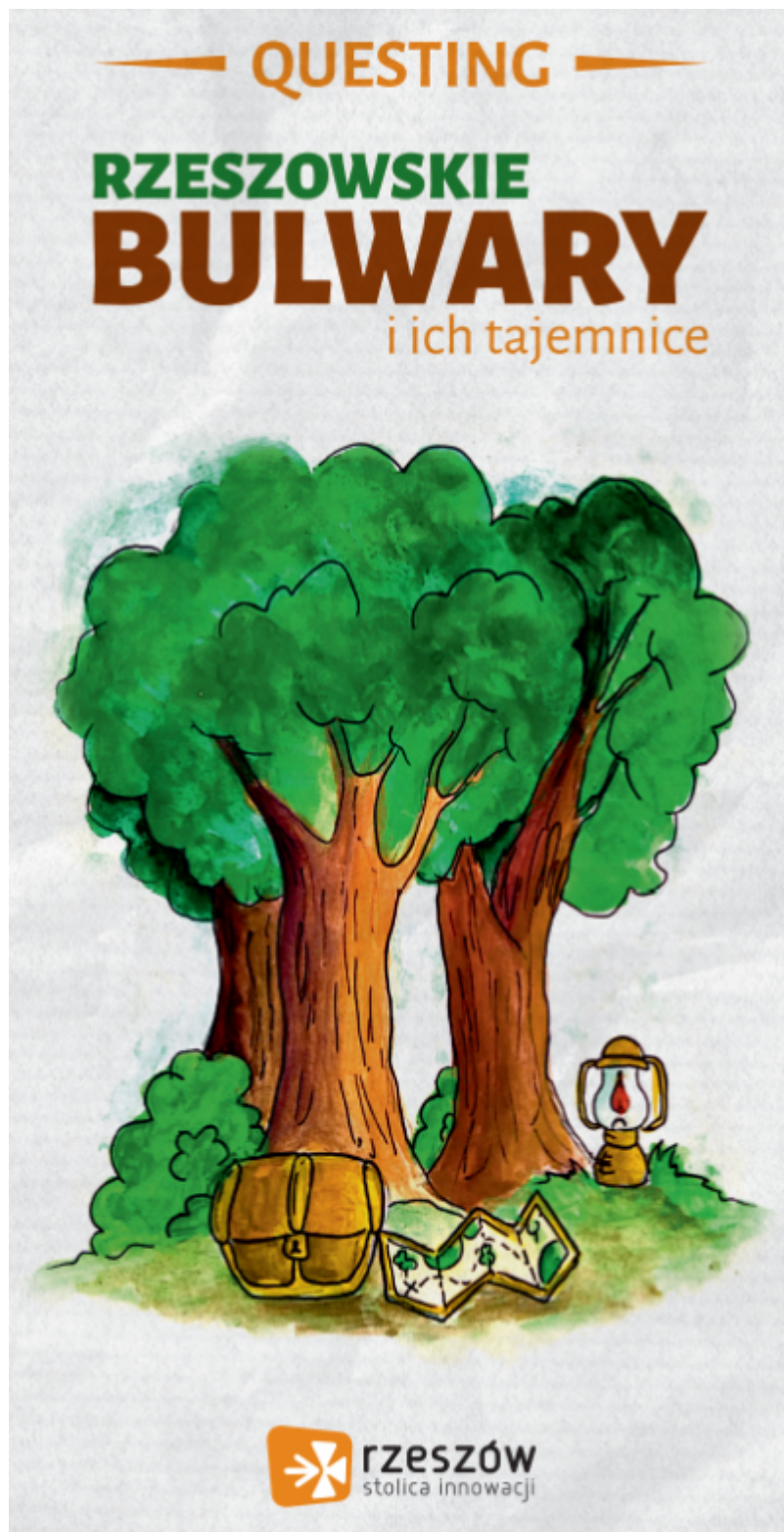
Quest Rzeszowskie bulwary i ich tajemnice