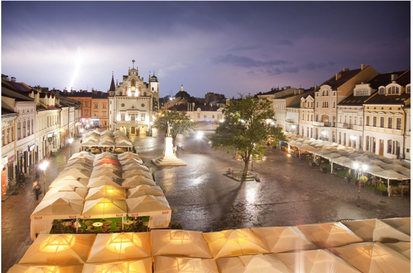
Rzeszowski Rynek