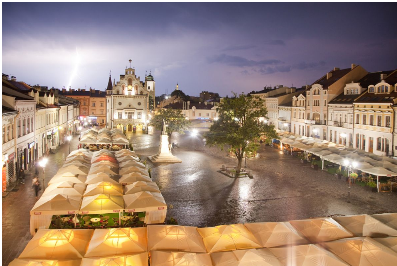
Rzeszowski Rynek