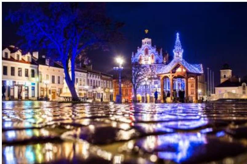
Rynek w nocy