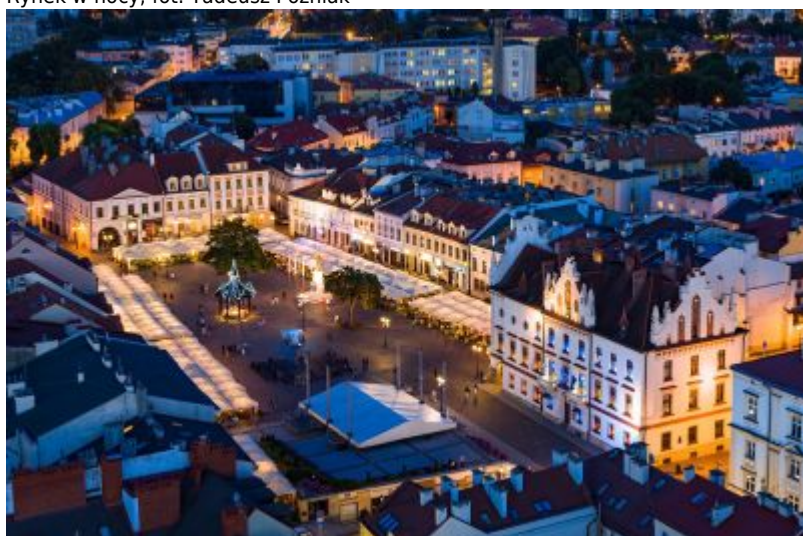
Rzeszowski Rynek