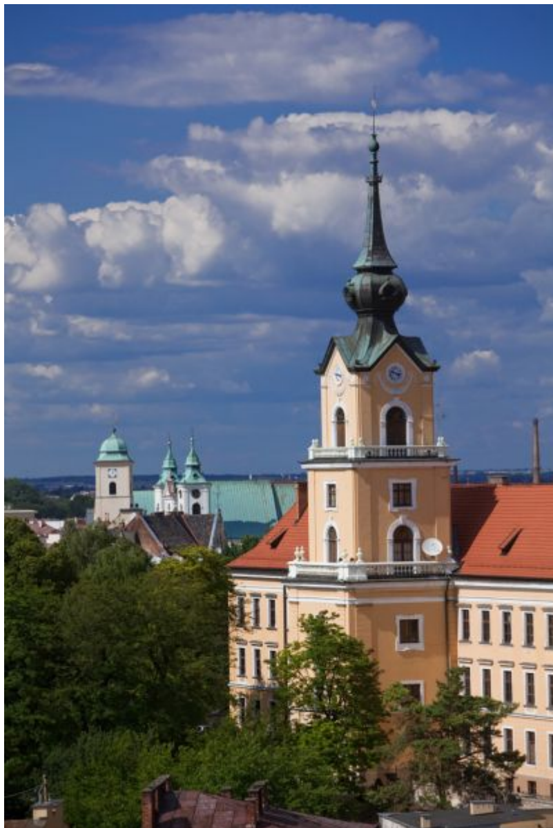
Zamek Lubomirskich