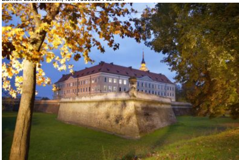
Zamek Lubomirskich

Rzeszowski zamek niewątpliwie jest jednym z najbardziej interesujących zabytków miasta – nie tylko ze względu na historię, ale również z uwagi na fakt, iż stanowi interesujące świadectwo myśli konserwatorskiej z przełomu wieków XIX i XX, kiedy to powstała jego obecna postać.