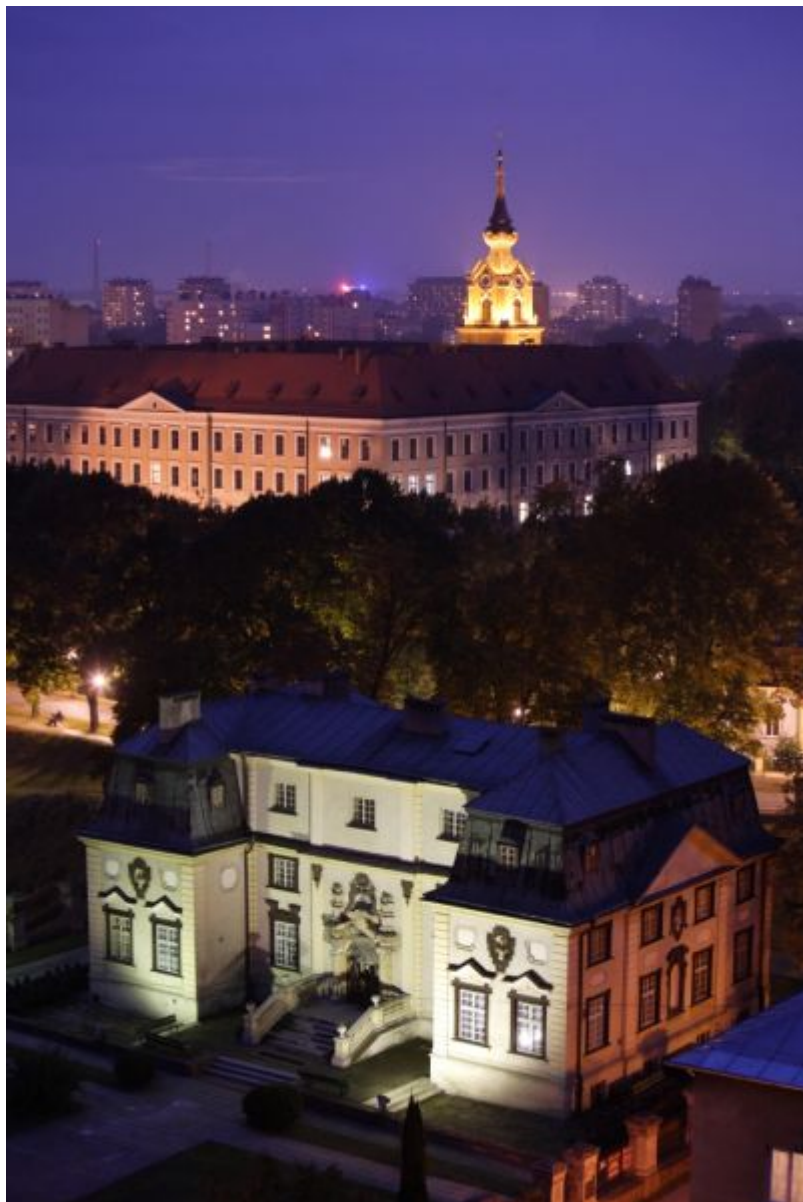
Zamek Lubomirskich