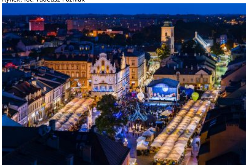
Rynek, fot. Tadeusz Poźniak