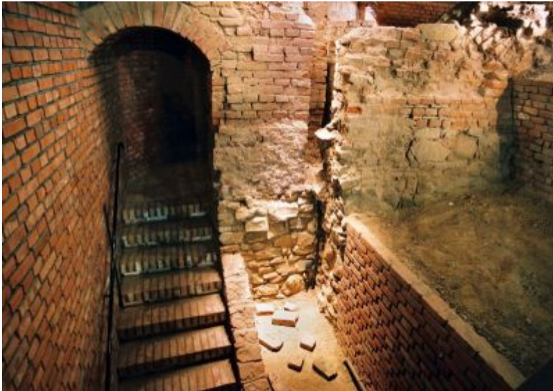
Podziemna Trasa Turystyczna