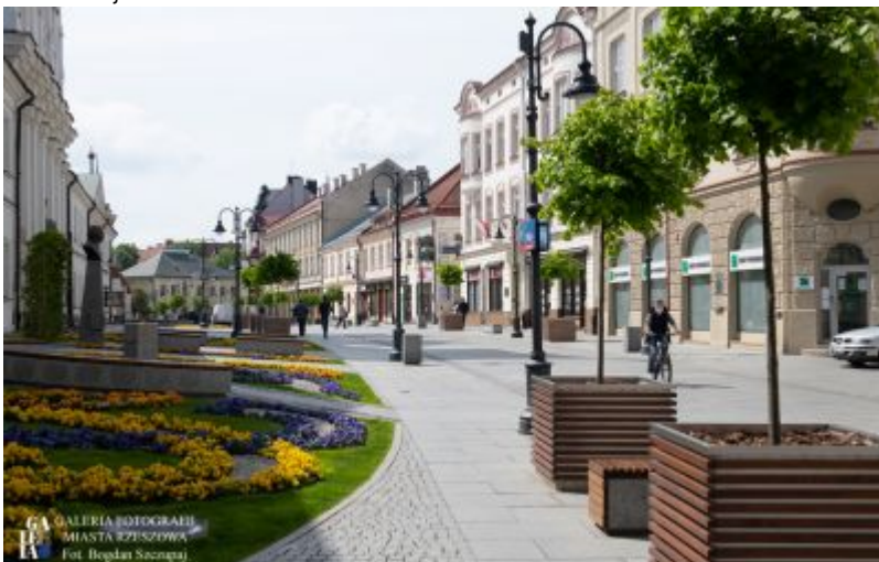
Ulica 3 Maja w 2020 r.

Ulica 3 Maja (dawna Paniaga) jest jedną z najstarszych i ładniejszych ulic śródmieścia. Stanowi reprezentacyjny deptak naszego miasta, miejsce rodzinnych i przyjacielskich spotkań.