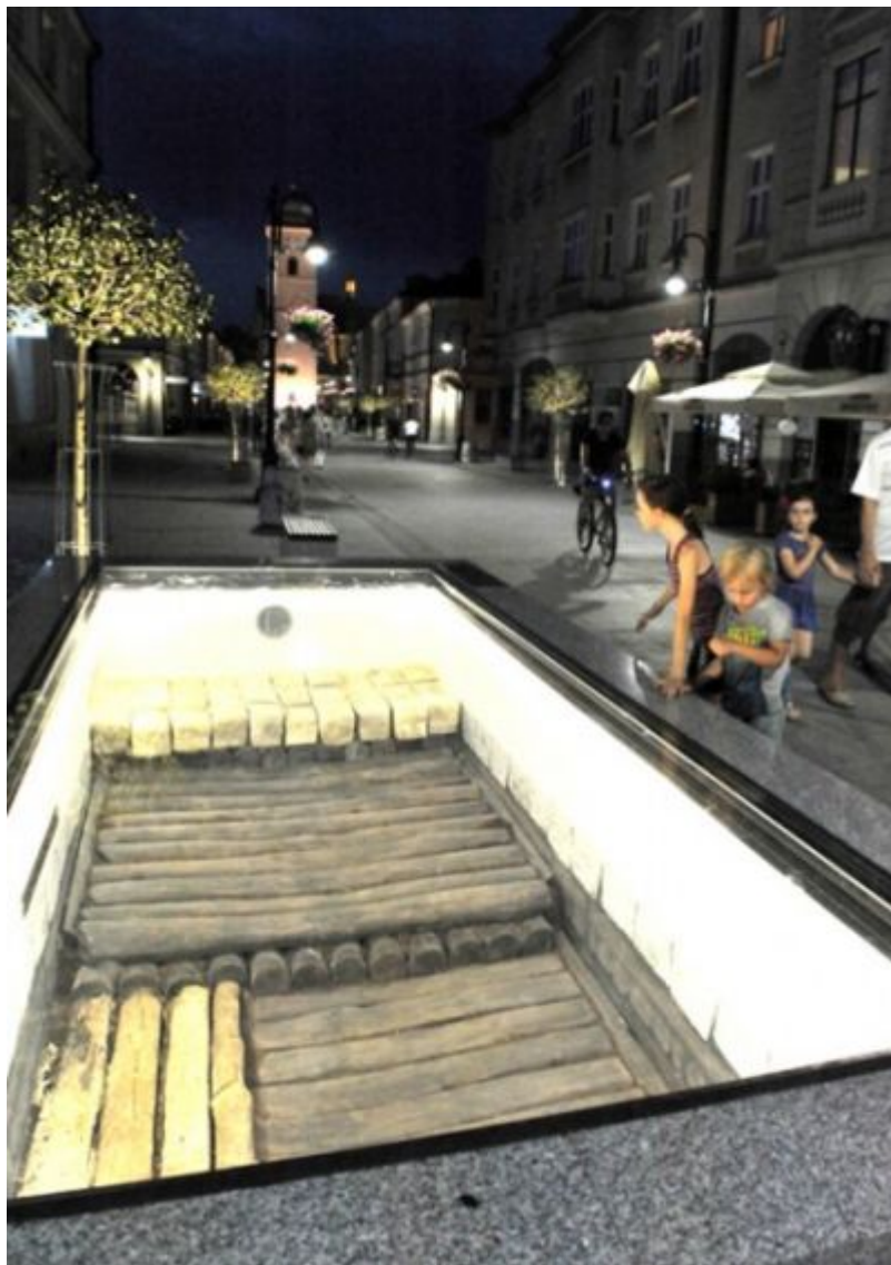
Ulica 3 Maja w 2017 r.