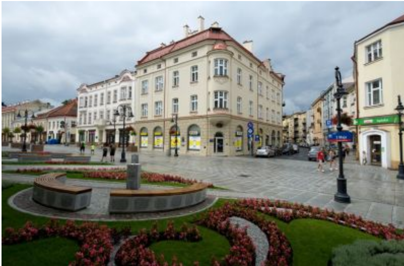
Ulica 3 Maja w 2018 r.