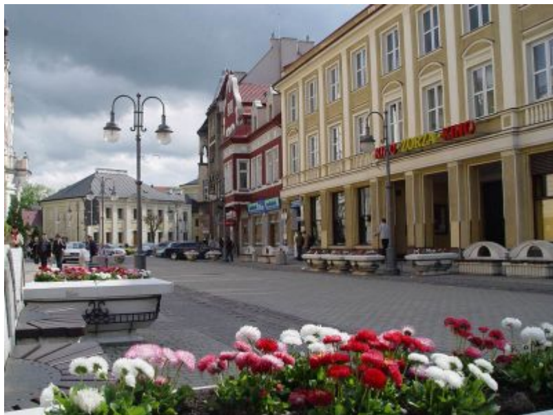
Ulica 3 Maja w 2010 r.