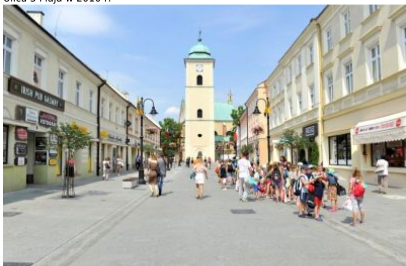
Ulica 3 Maja w 2017 r.