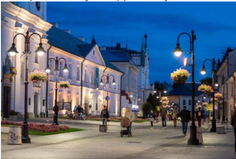
Ulica 3 Maja w 2018 r.