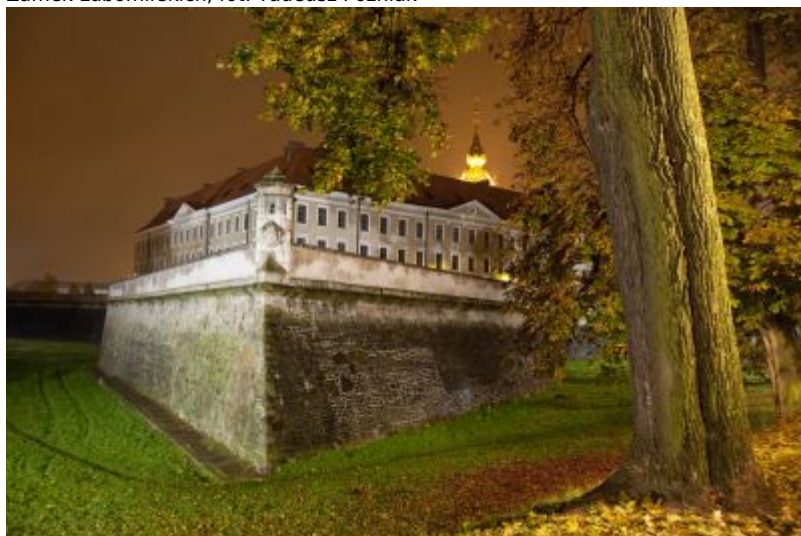
Zamek Lubomirskich

Genezę rzeszowskiego zamku możemy prześledzić od działalności Mikołaja Spytka Ligęzy. W szeregu inwestycji podjętych przez Spytka było umocnienie miasta i budowa zamku. Ta ostatnia rozpoczęła się w k. XVI w. na południe od miasta adaptując istniejący w tym miejscu korzystny układ wodny. Już w 1620 r. Mikołaj podjął przebudowę zamku w typie palazzo in fortezza. Powstały umocnienia ziemne, wały, bastiony w obowiązującym wówczas systemie nowowłoskim. Spyttek umiera w 1637 r. nie ukończywszy swego zamierzenia.