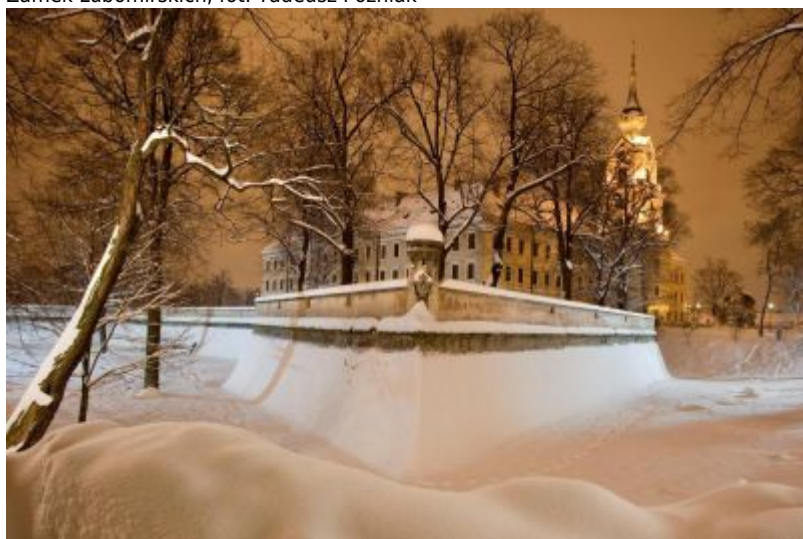
Zamek Lubomirskich