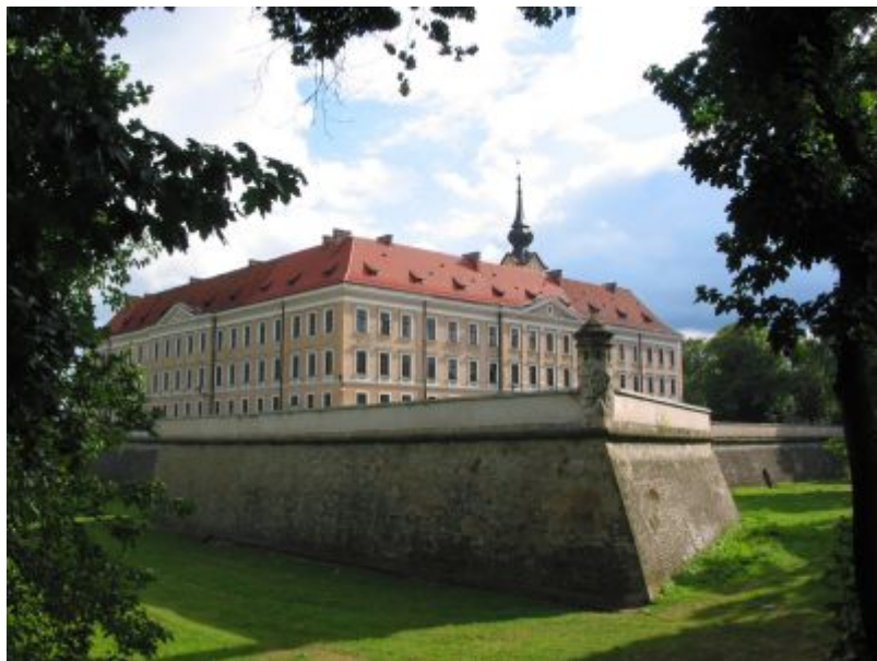
Zamek Lubomirskich, fot. Tadeusz Poźniak