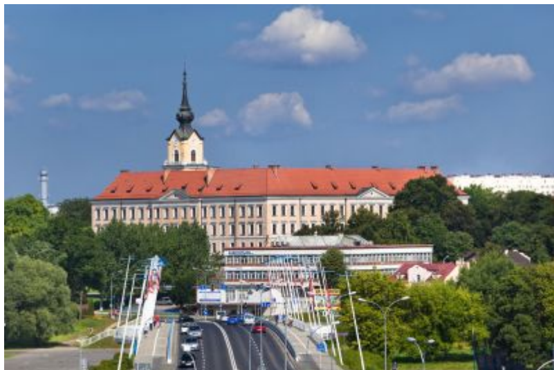
Zamek Lubomirskich