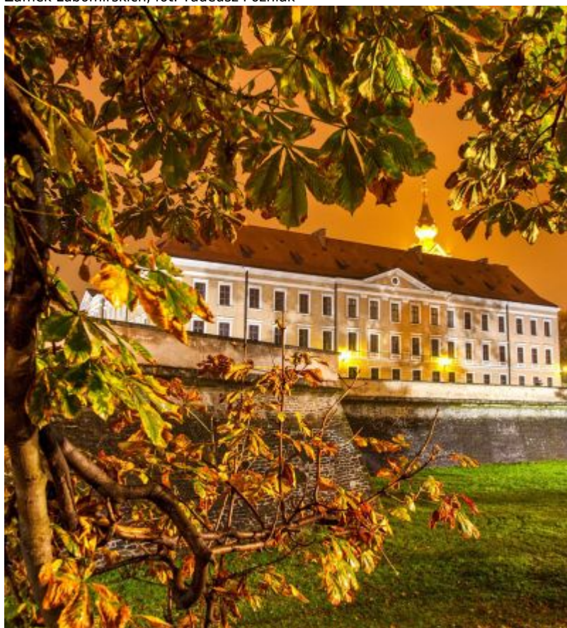
Zamek Lubomirskich