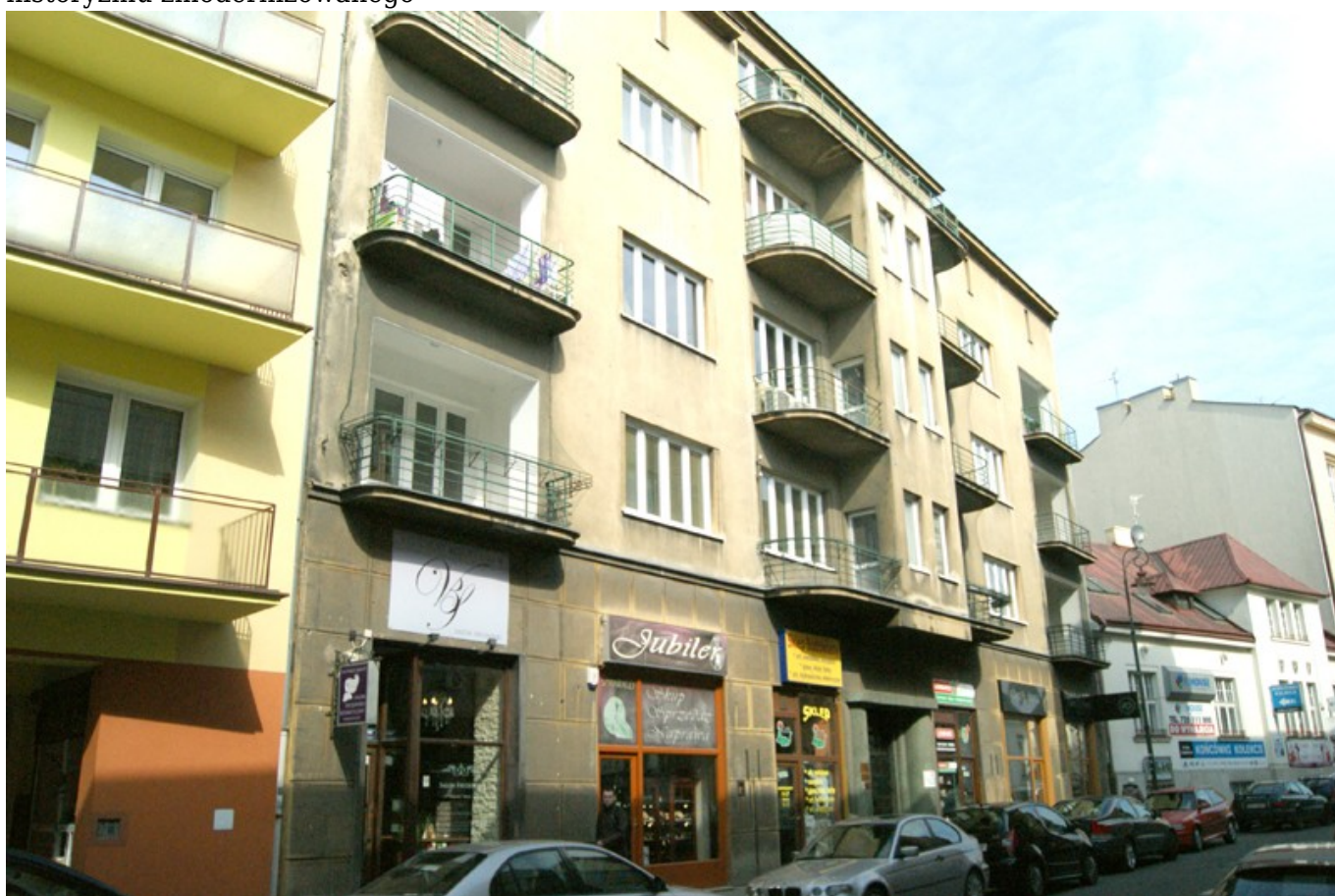
Kamienica wg proj. Karola Holzera przy ul. Jagiellońskiej