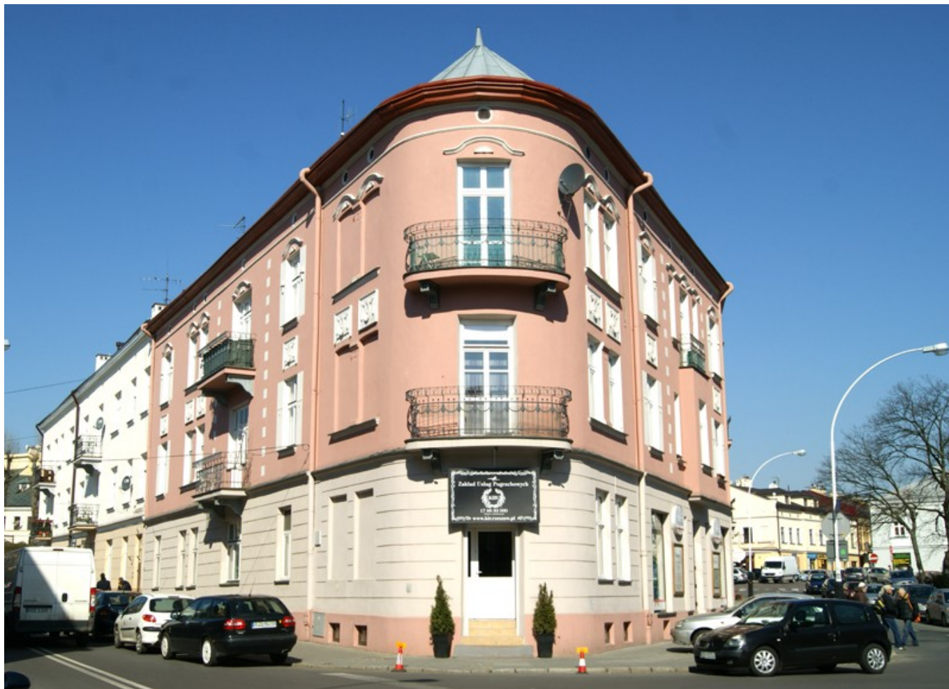
Kamienica przy ul. Kreczmera wg projektu Ludwika i Karola Holzerów