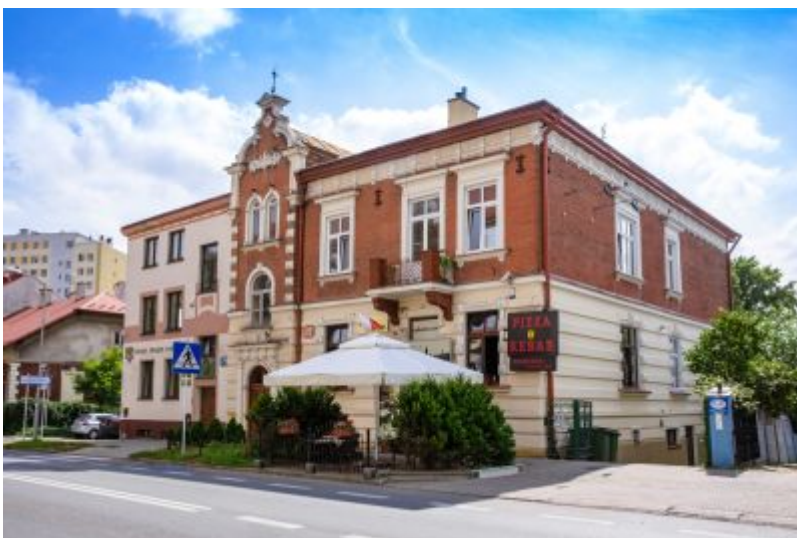
Murowany dom mieszkalny przy ul. ks. Jałowego

Zabytkowe kamienice zachowane na terenie miasta Rzeszowa są przede wszystkim świadectwem rozwoju miasta począwszy od połowy XIX w. Kamienice rzeszowskie, zwłaszcza te zlokalizowane w Rynku Starego Miasta i jego najbliższej okolicy posiadają w swych murach części znacznie starsze, nawet XV-wieczne, jednak ich ostateczna forma architektoniczna ukształtowana została dopiero w II połowie, a zwłaszcza w końcu XIX w. i początkach XX w. Obok tych najstarszych kamienic powstających od XV i XVI w., następnie wielokrotnie przekształcanych i przebudowywanych, znajdujemy też na terenie miasta interesujące obiekty, które wznoszono od podstaw począwszy od 2 połowy XIX w. do lat 20. i 30. XX w.