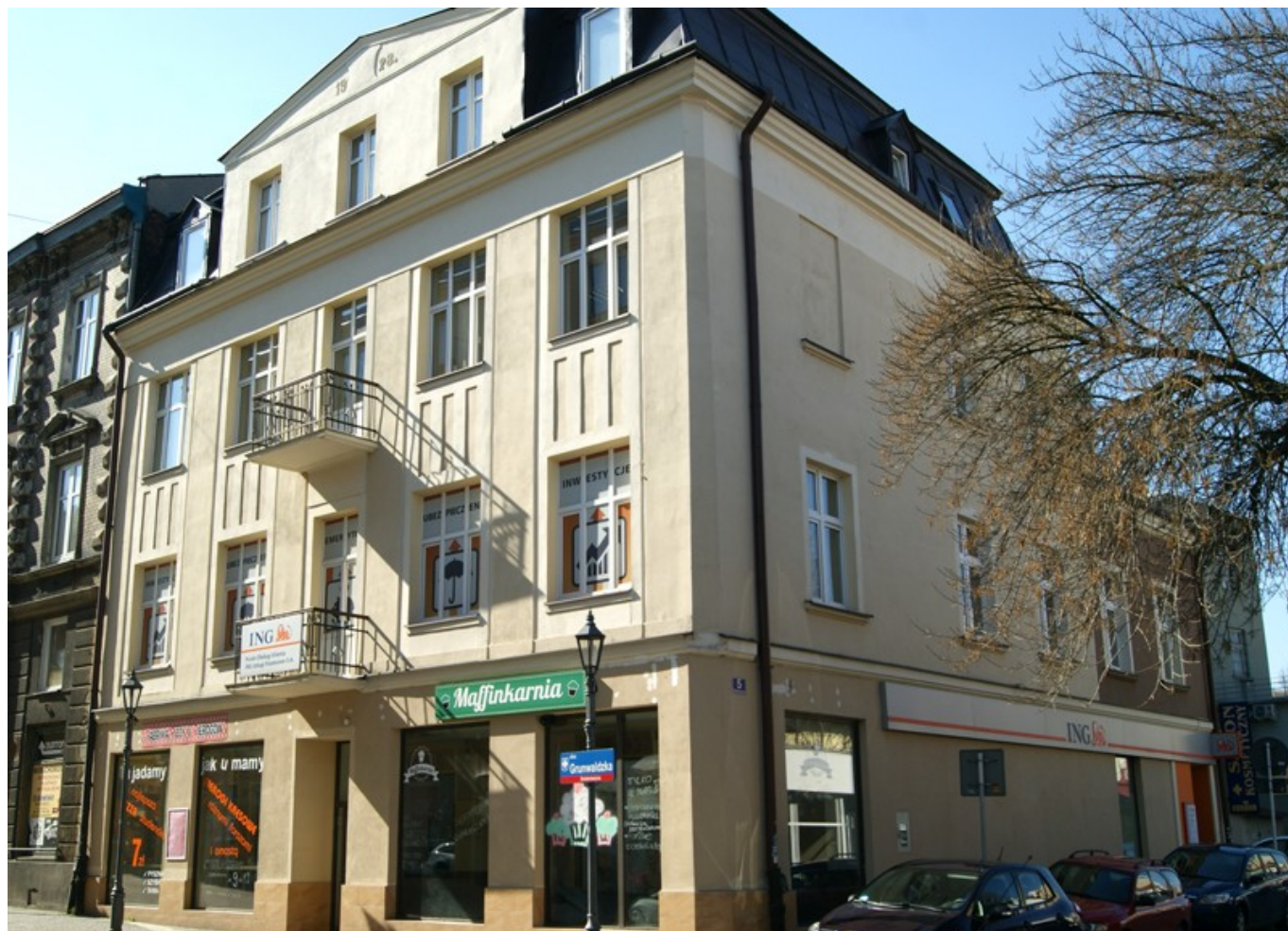
Kamienica przy ul. Grunwaldzkiej