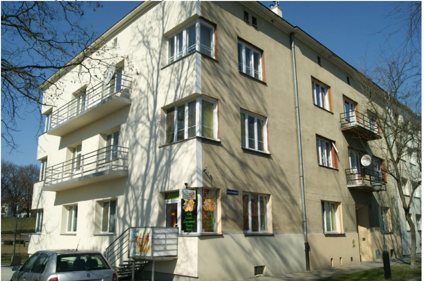
Kamienica przy ul. PCK