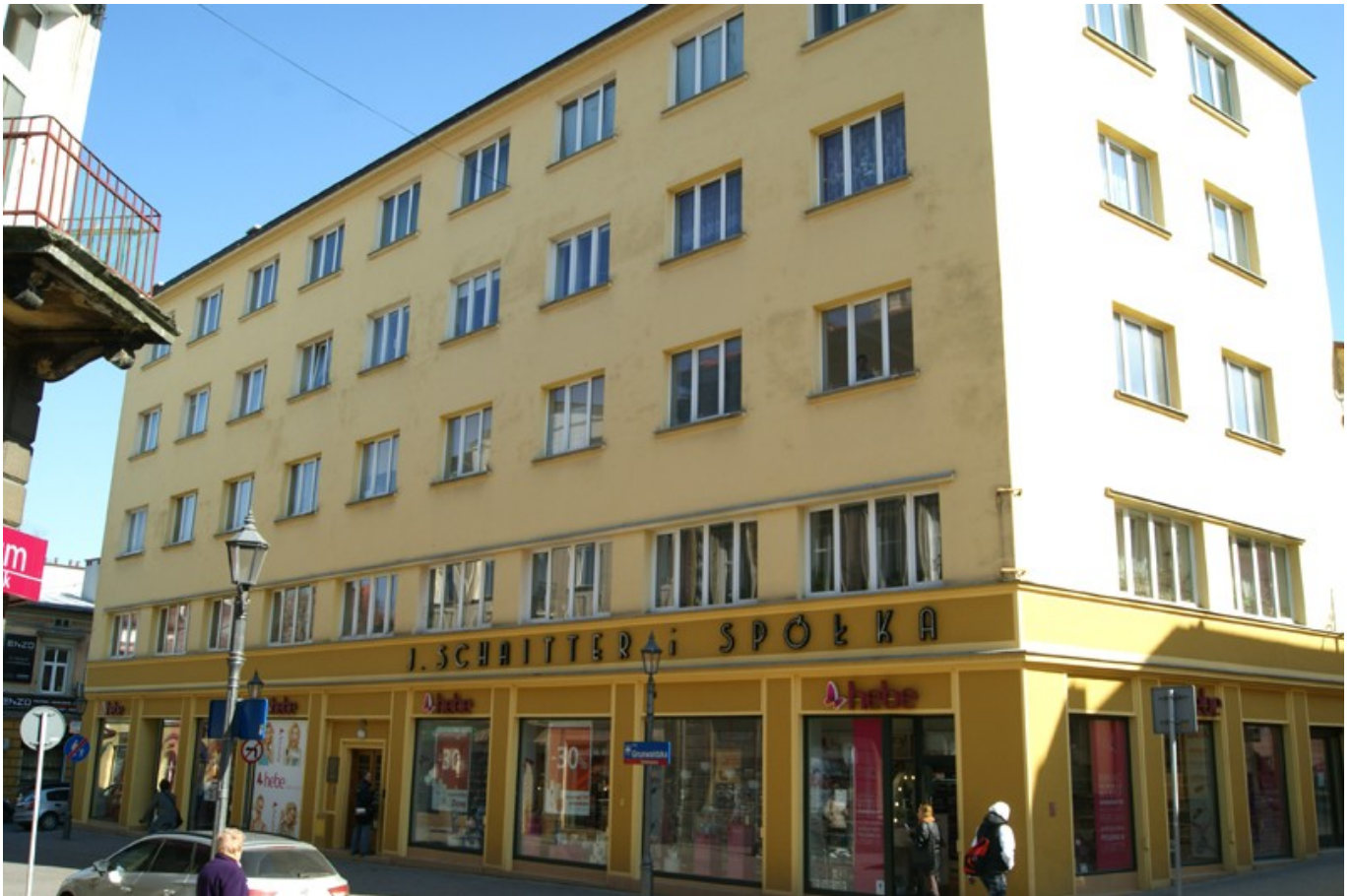
Budynek przy ul. Grunwaldzkiej wybudowany w 1936 r. dla firmy Schaiter i S-ka wg proj. Józefa Wetzsteina