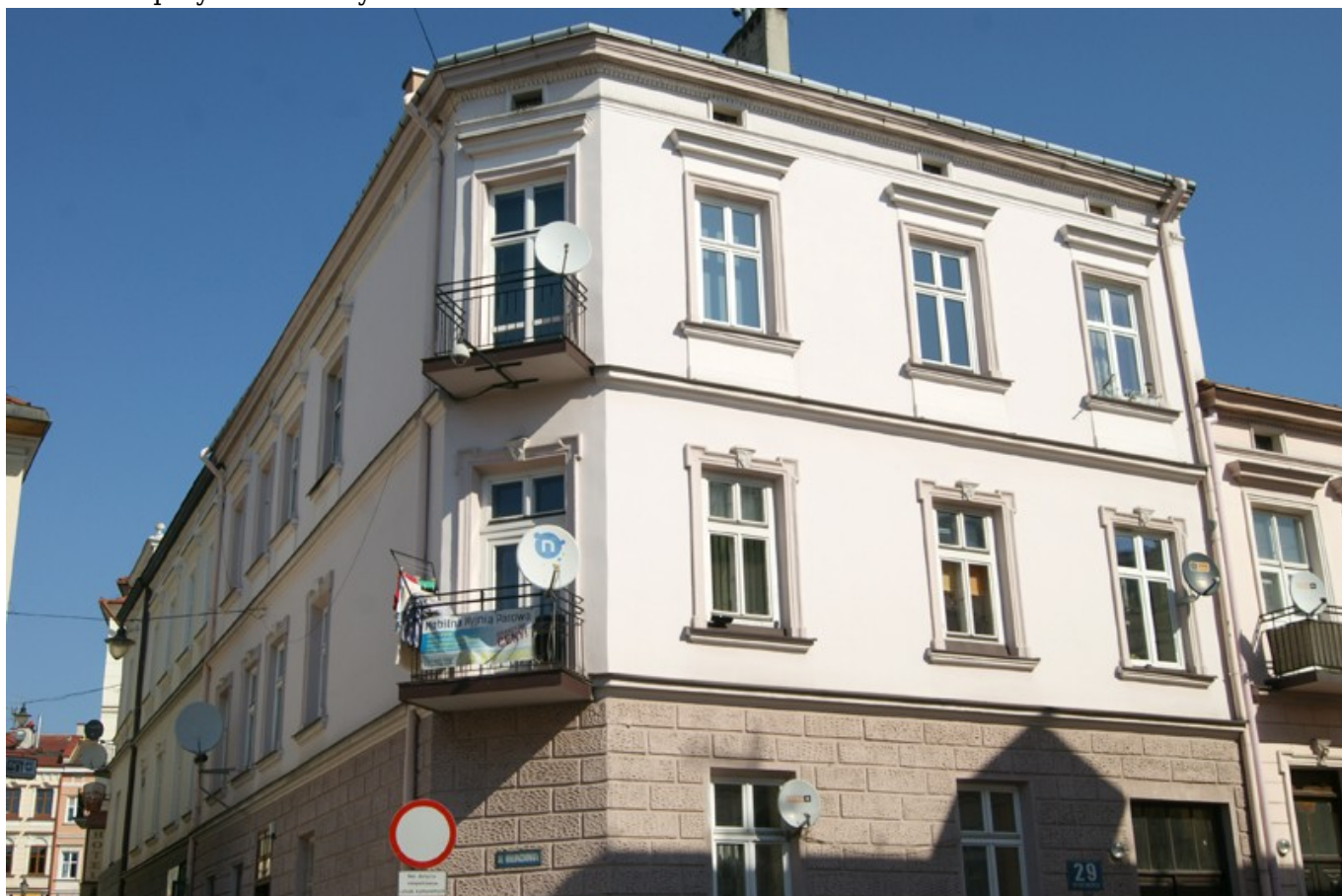
Kamienica przy ul. Króla Kazimierza