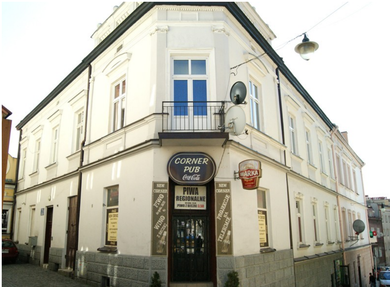
Kamienica przy ul. Przesmyk