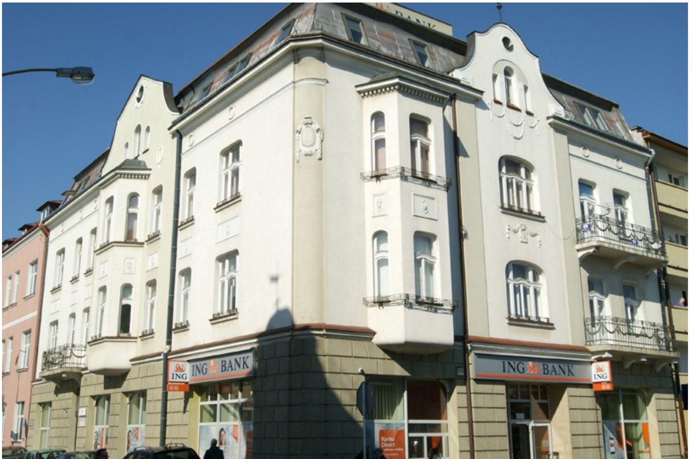
Kamienica przy ul. Sobieskiego