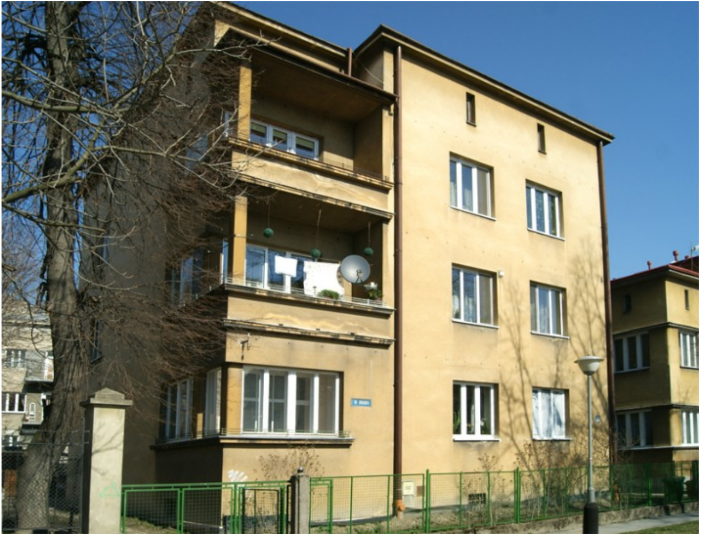
Kamienica Uzarskich z 1935 r. wg proj. Karola Holzera przy ul. Dekerta