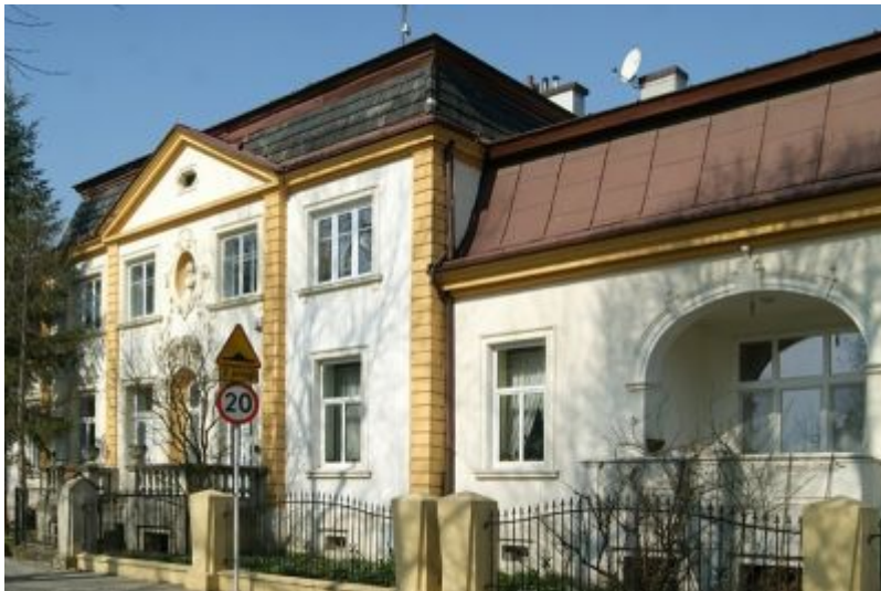
Willa "Pod kasztanami"