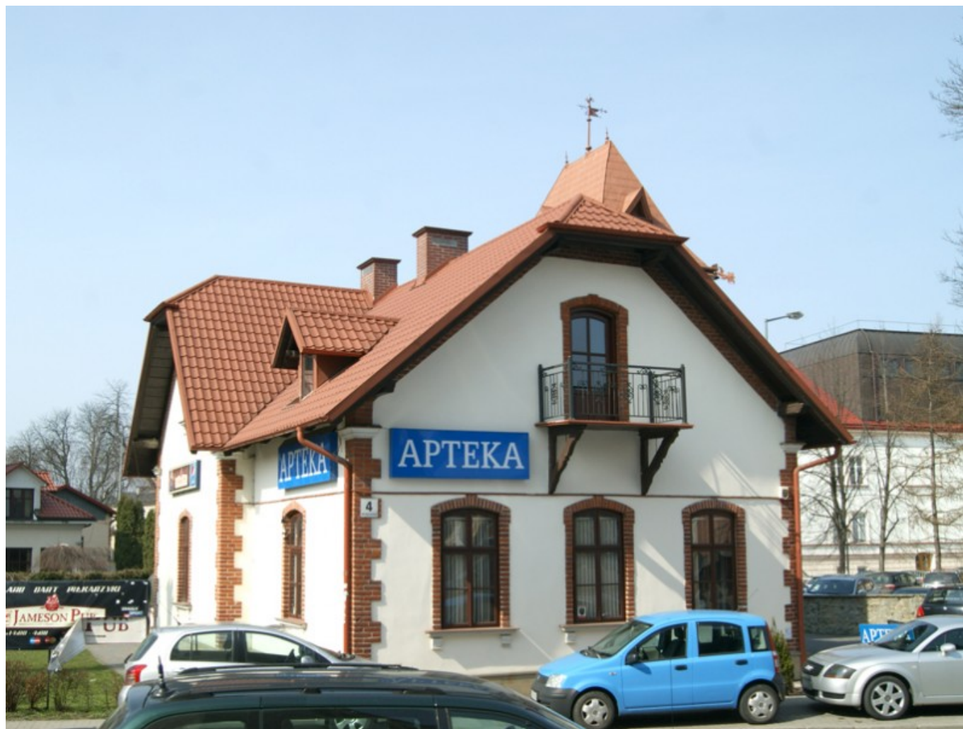
Willa przy ul. Moniuszki