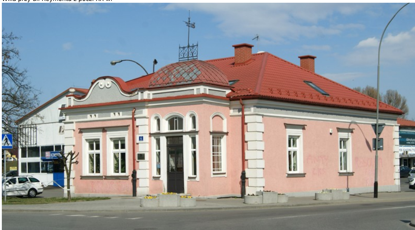
Parterowa willa przy ul. Krakowskiej z końca XIX w.