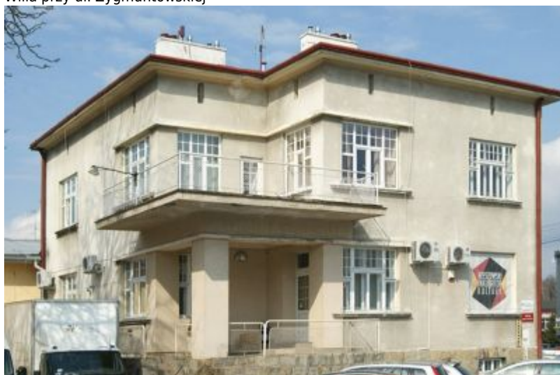
Willa przy ul. Jagiellońskiej