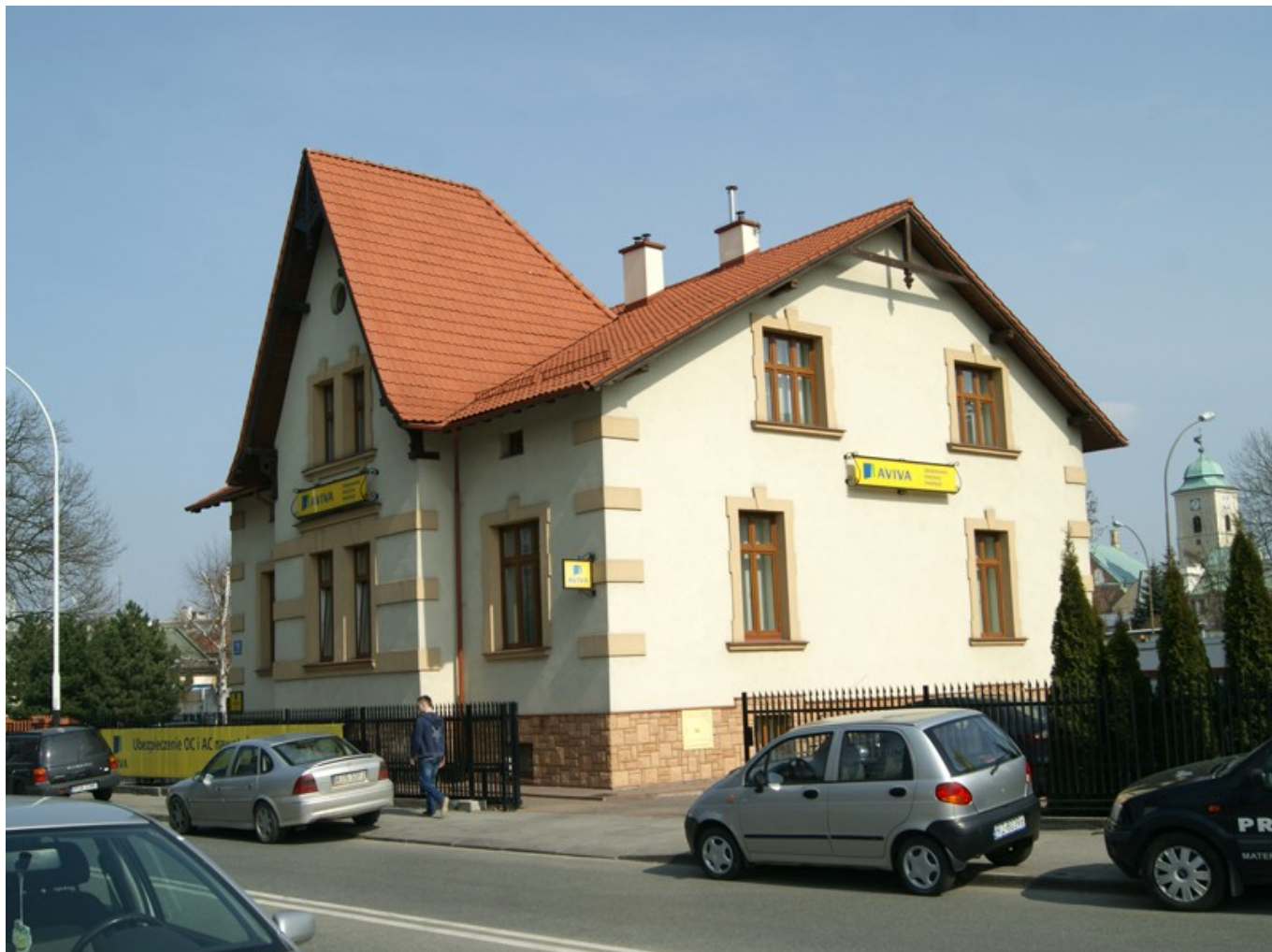
Willa przy ul. Moniuszki