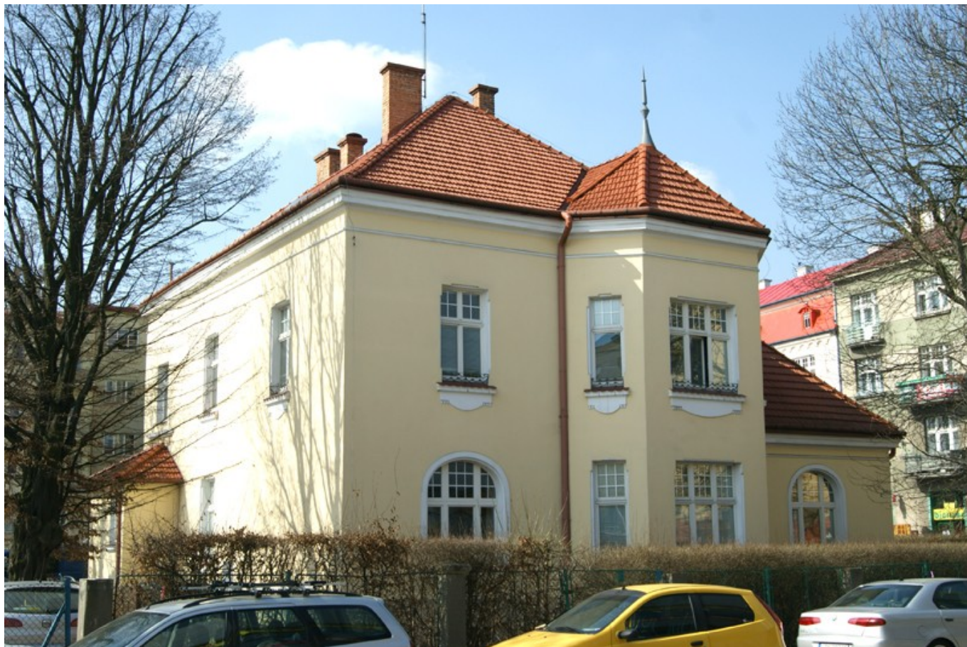
Willa przy ul. Jagiellońskiej