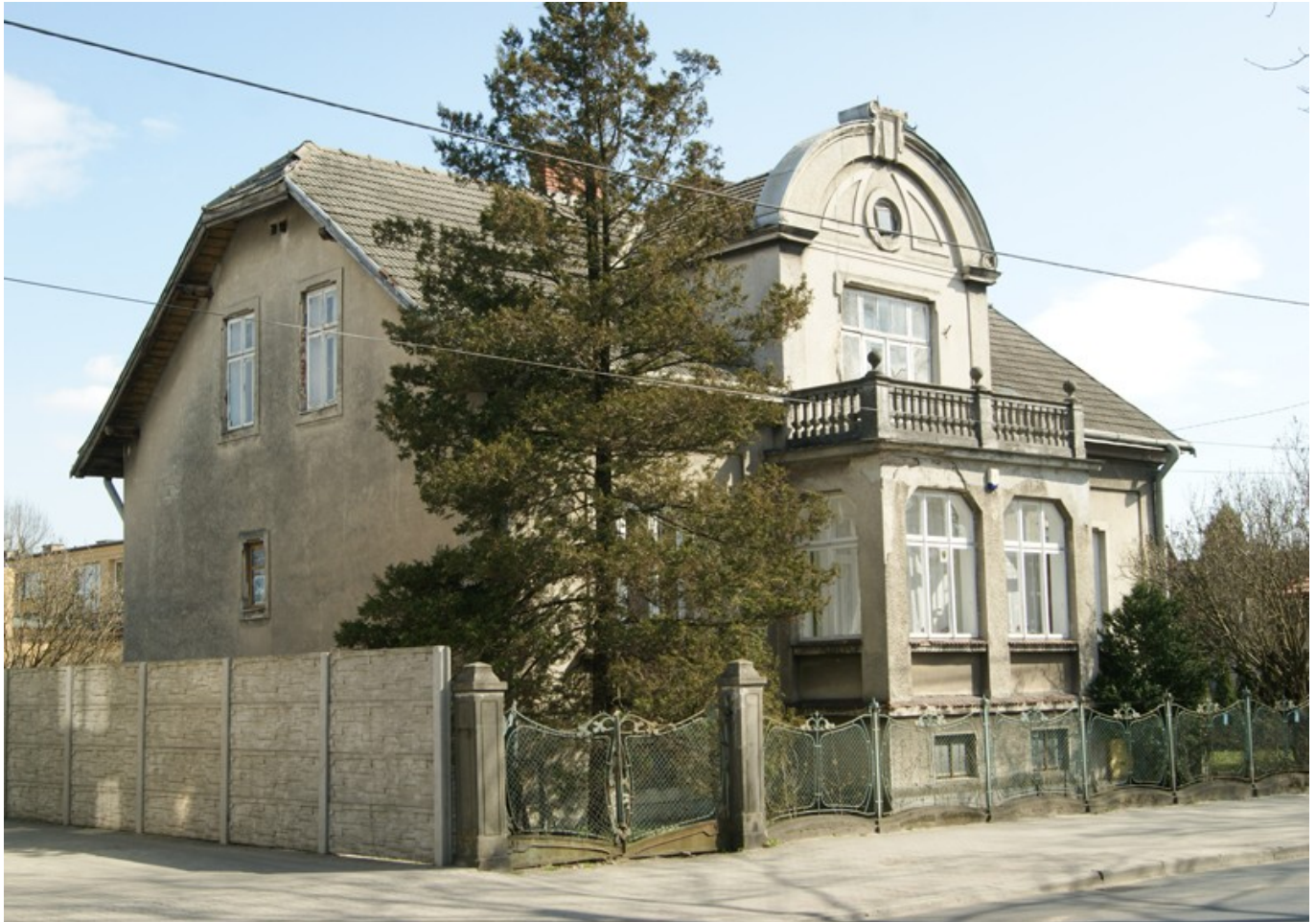
Willa przy ul. Króla Augusta

Architektura willowa - domy o charakterze reprezentacyjnym budowane w ogrodach nie występują zbyt licznie na terenie Rzeszowa w porównaniu do innych tej skali miast.