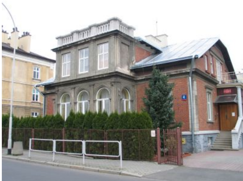
Willa przy ul. Unii Lubelskiej, obecnie siedziba Pogotowia Opiekuńczego