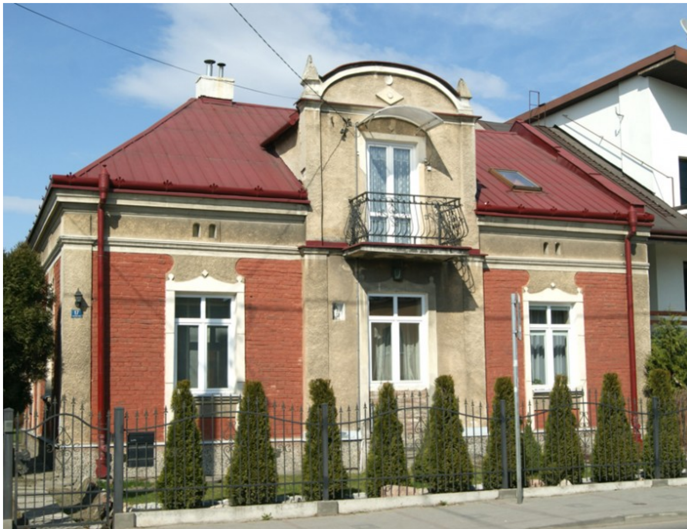
Willa przy ul. Reymonta z pocz. XX w.