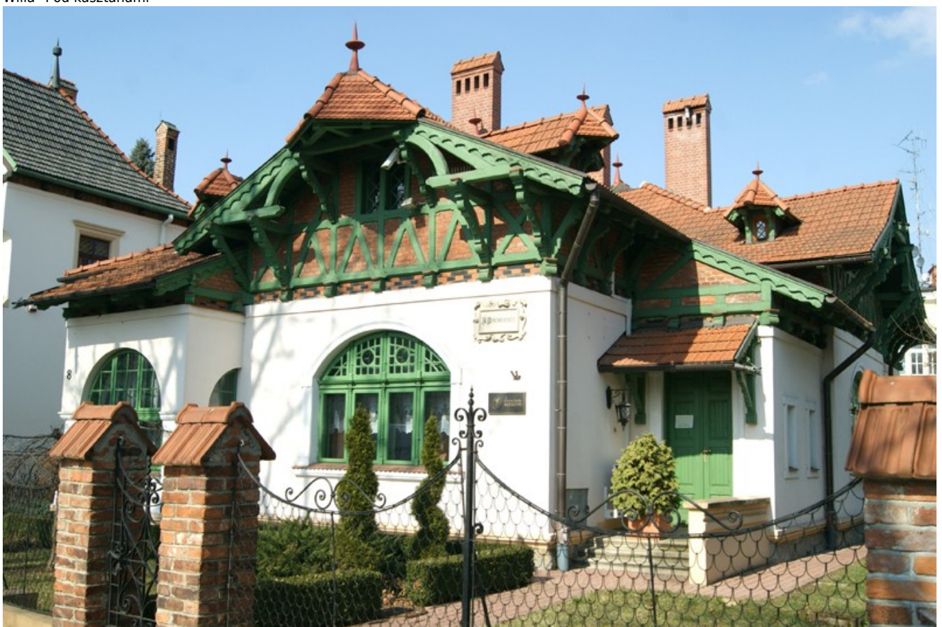
Willa "Pod kasztanami"