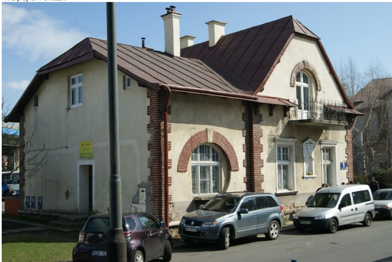
Willa przy ul. Kasprowicza z pocz. XX w.