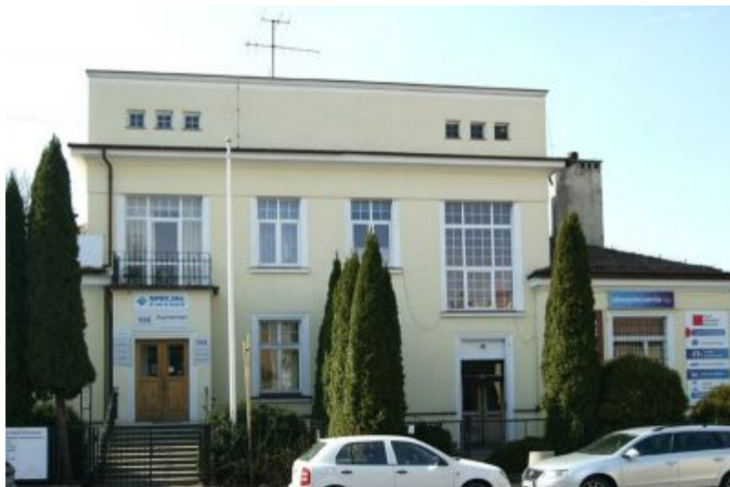
Willa przy ul. Zygmuntowskiej