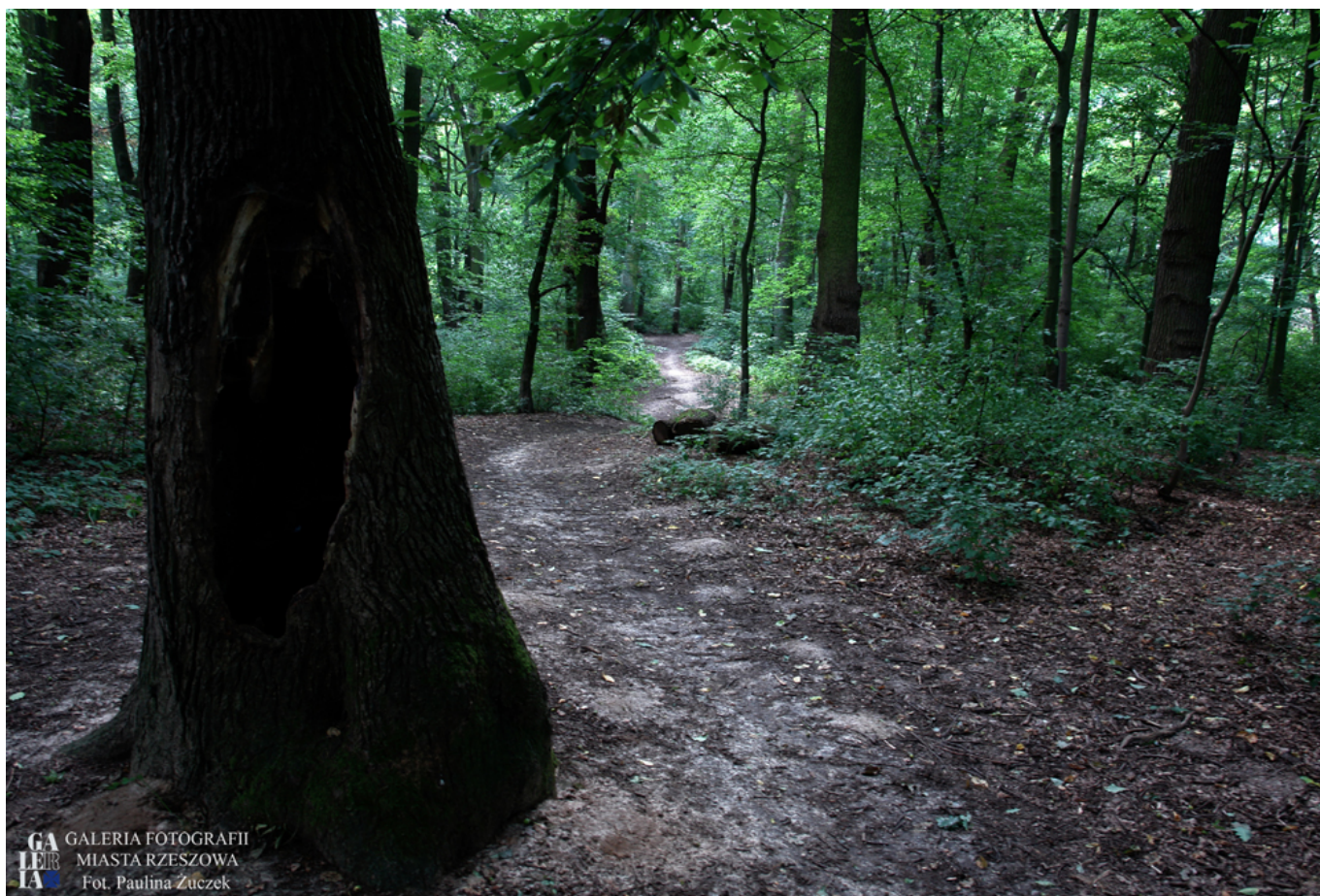
Park na Lisiej Górze