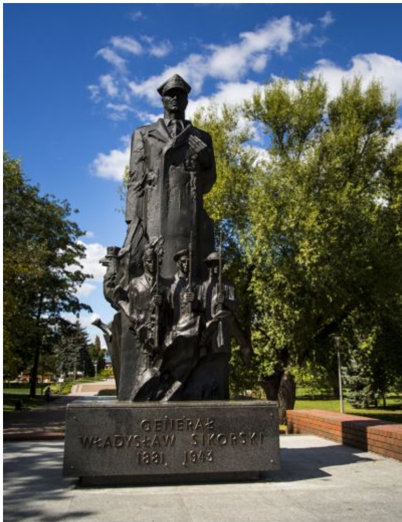
Pomnik gen. Władysława Sikorskiego w parku Jedności Polonii z Macierzą, fot. Tadeusz Poźniak