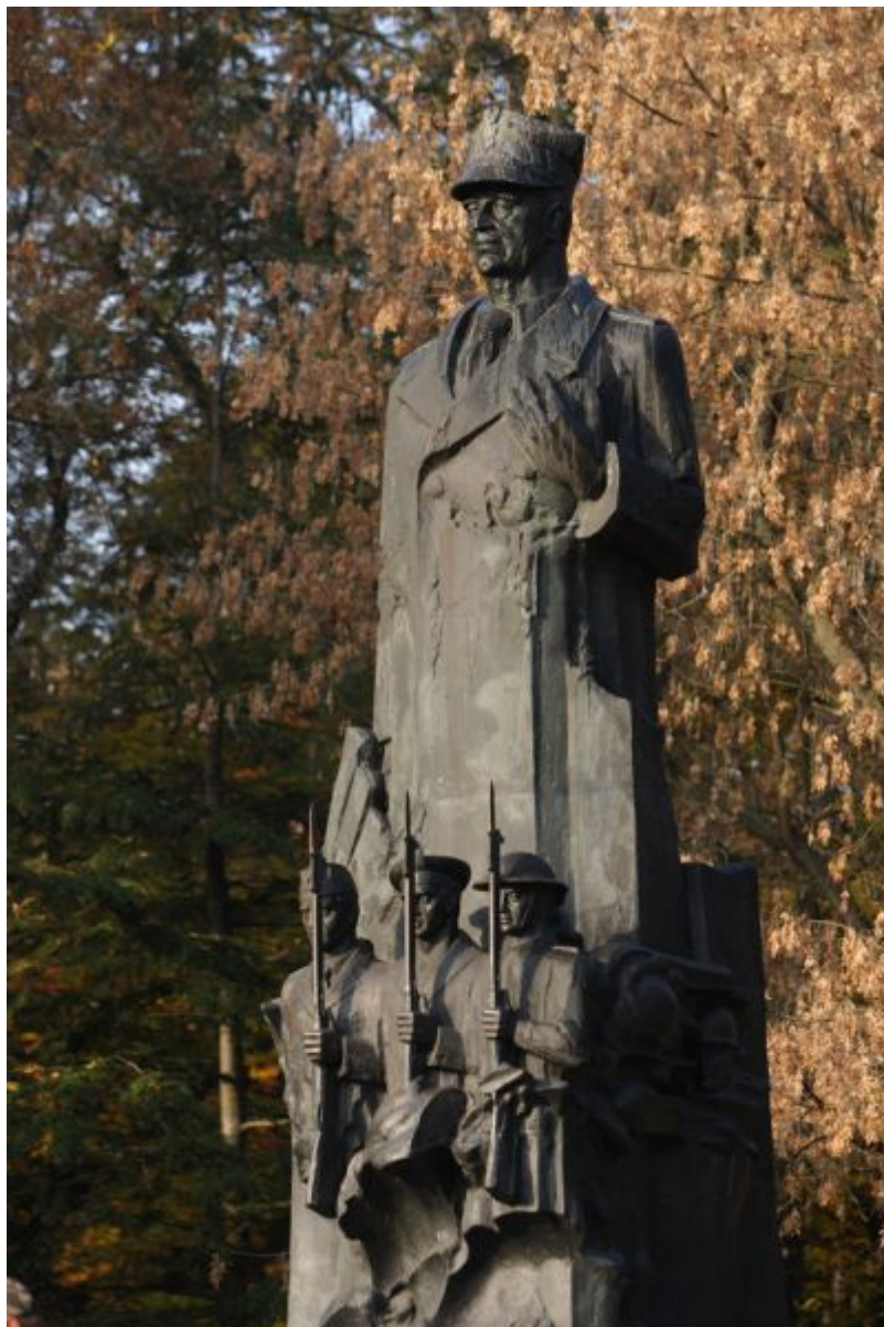
Pomnik gen. Władysława Sikorskiego w parku Jedności Polonii z Macierzą