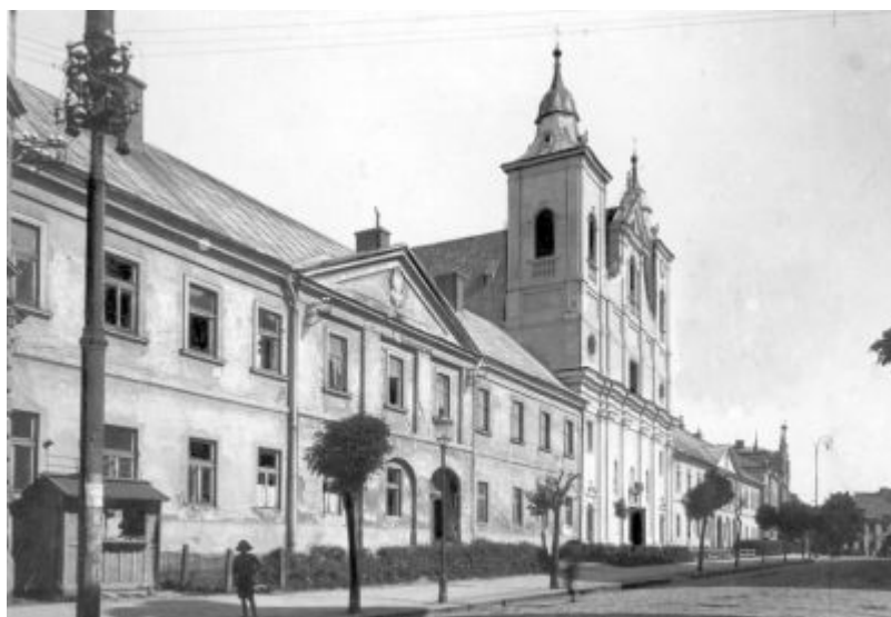
Gimnazjum rzeszowskie w okresie międzywojennym.