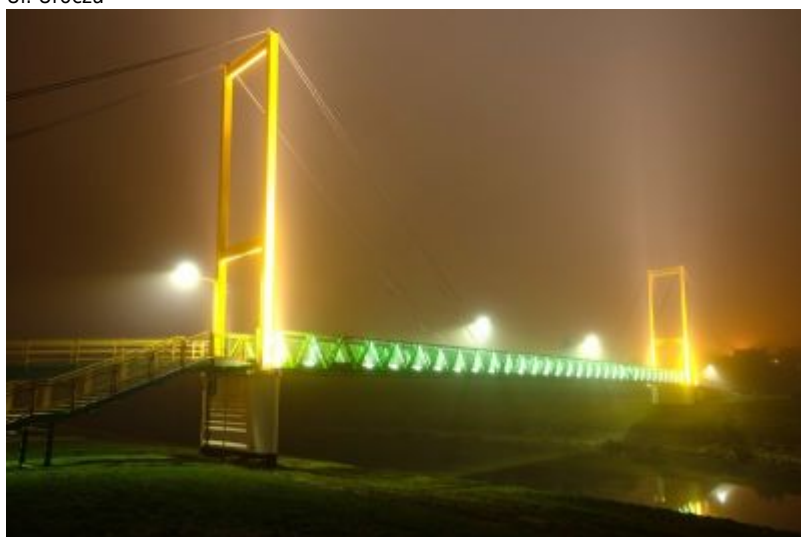
Kładka nad Wiślokiem