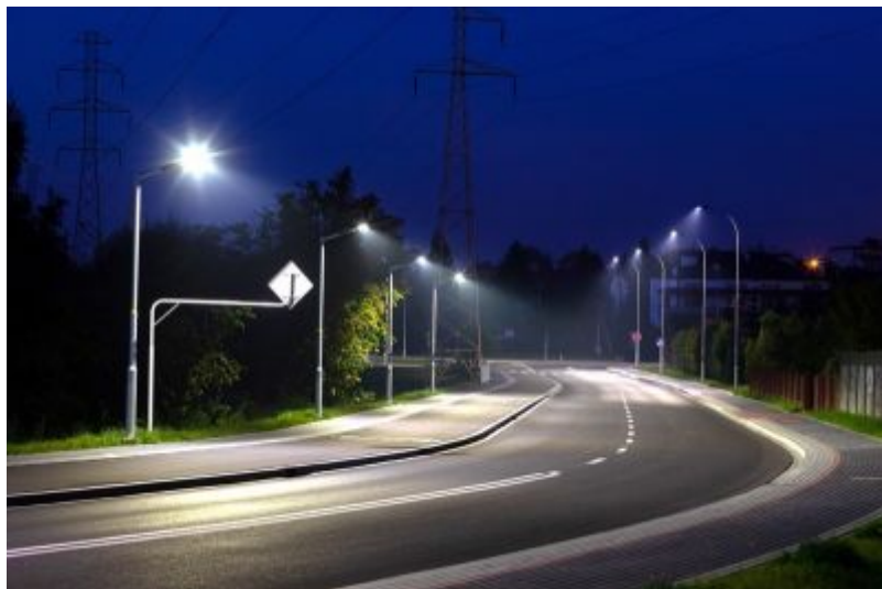
Droga łącząca ul. Krośnieńską i Ustrzycką