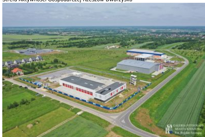
Strefa Aktywności Gospodarczej Rzeszów-Dworzysko