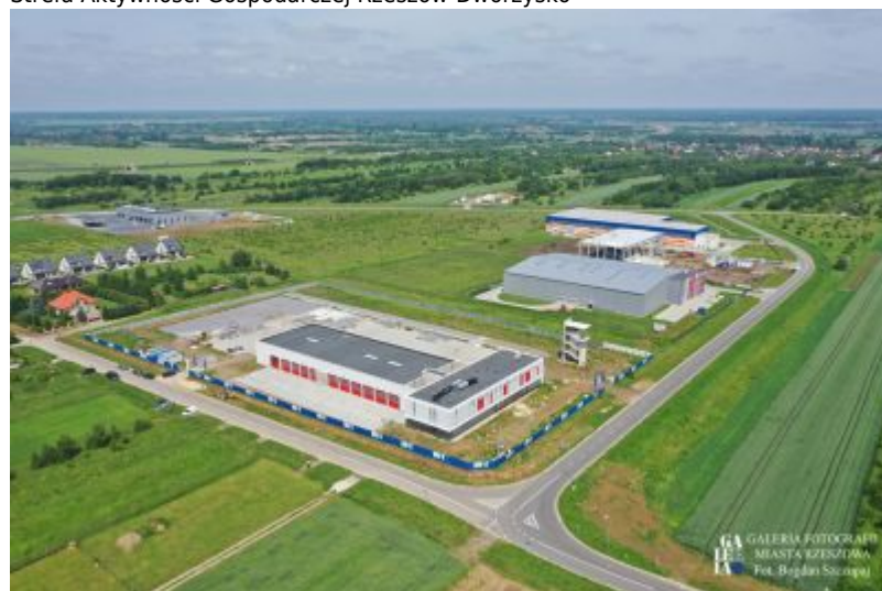
Strefa Aktywności Gospodarczej Rzeszów-Dworzysko