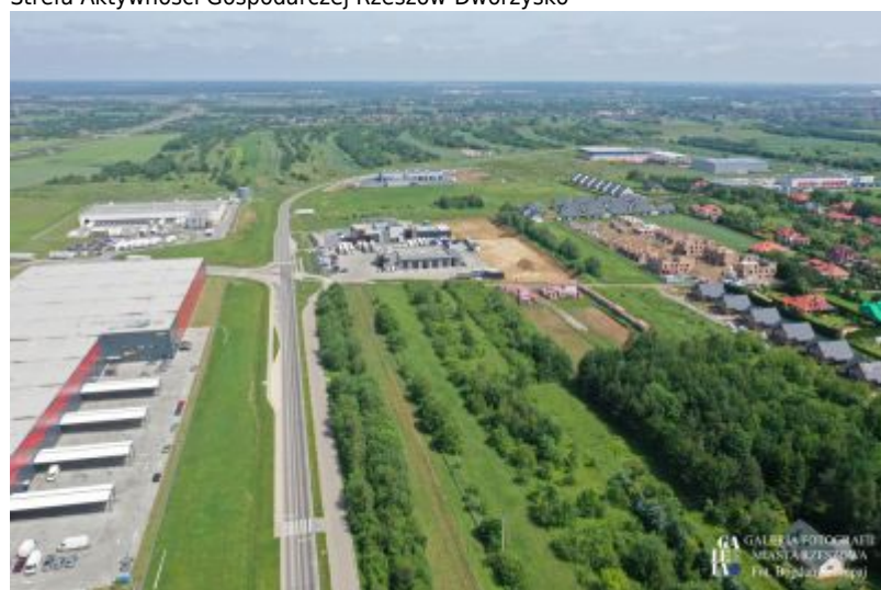
Strefa Aktywności Gospodarczej Rzeszów-Dworzysko