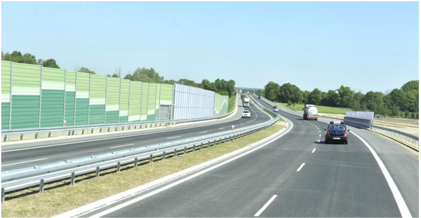
Łącznik do autostrady A4