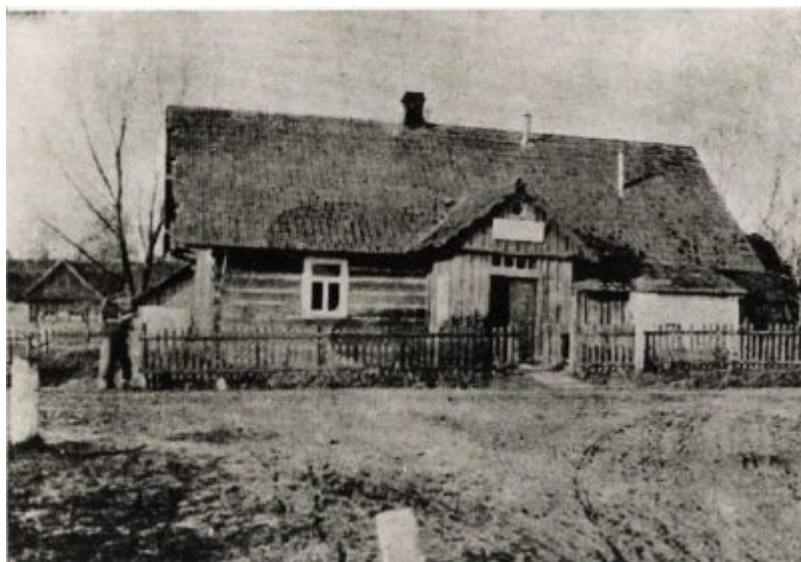
Spółdzielczość mleczarska w Galicji