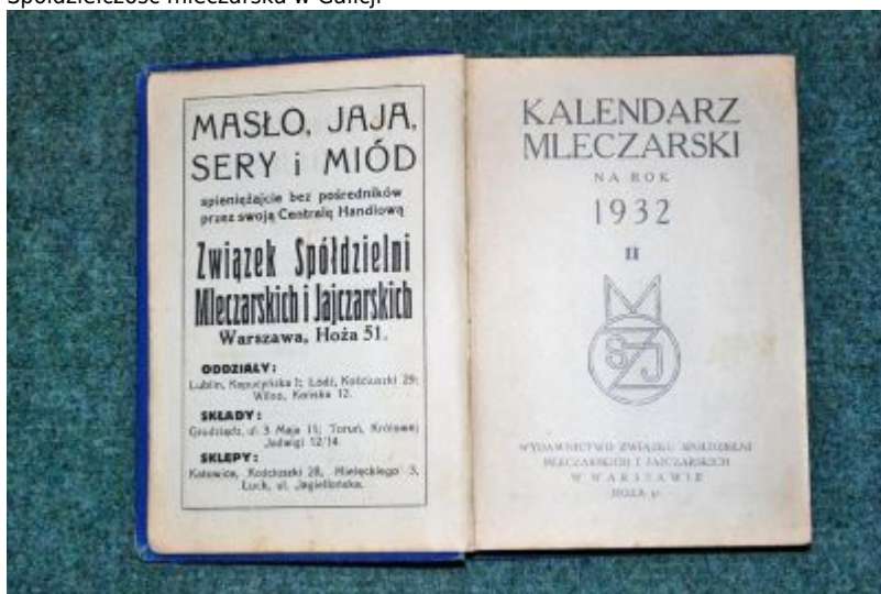
Wydawnictwo książkowe Związku Spółdzielni Mleczarskich i Jajczarskich