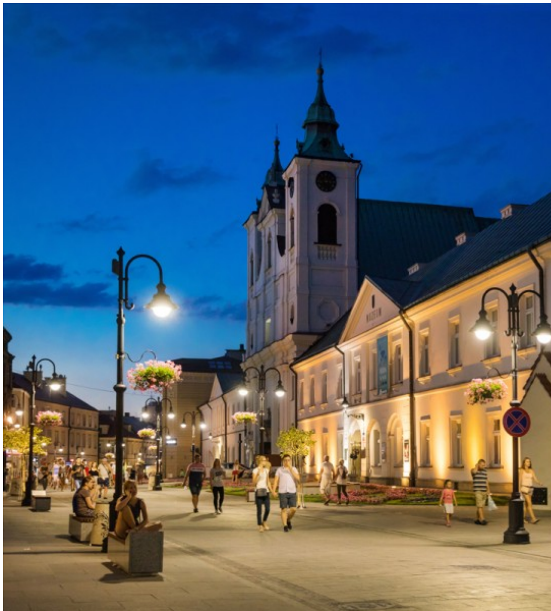
Ulica 3 Maja