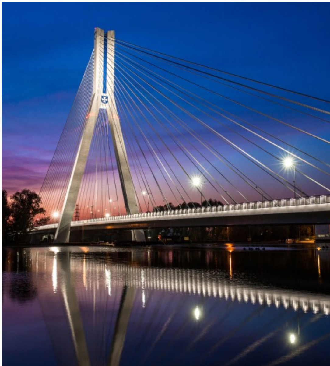
Most im. Tadeusza Mazowieckiego