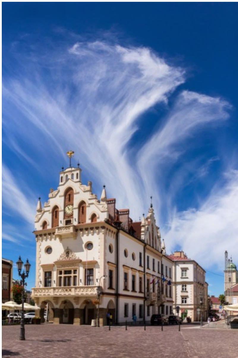
Ratusz - siedziba władz miasta