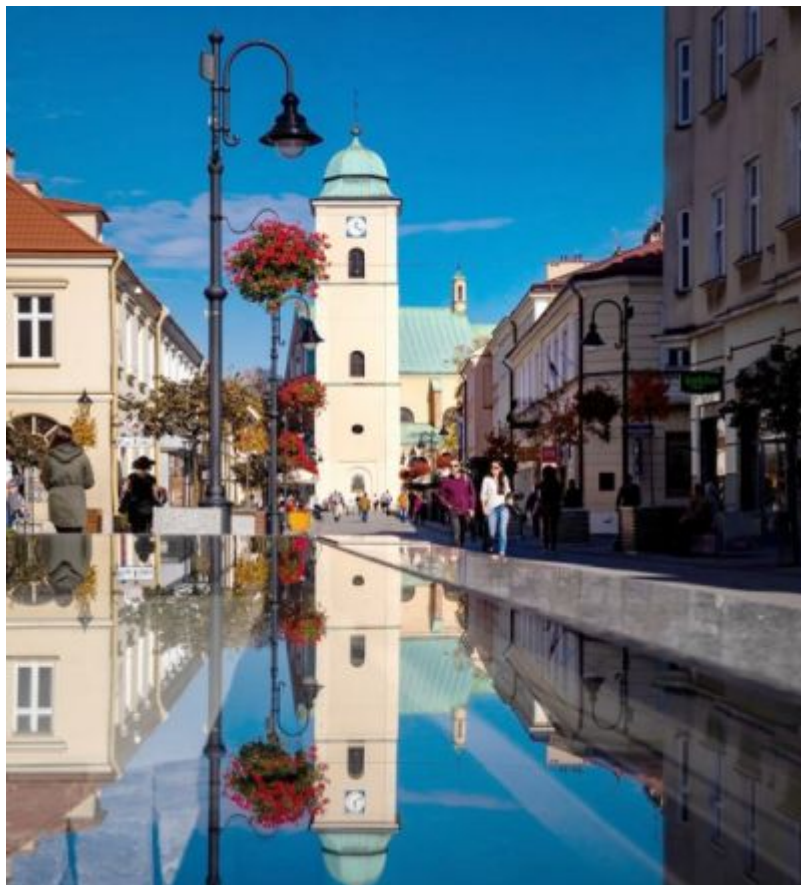
Ulica 3 Maja