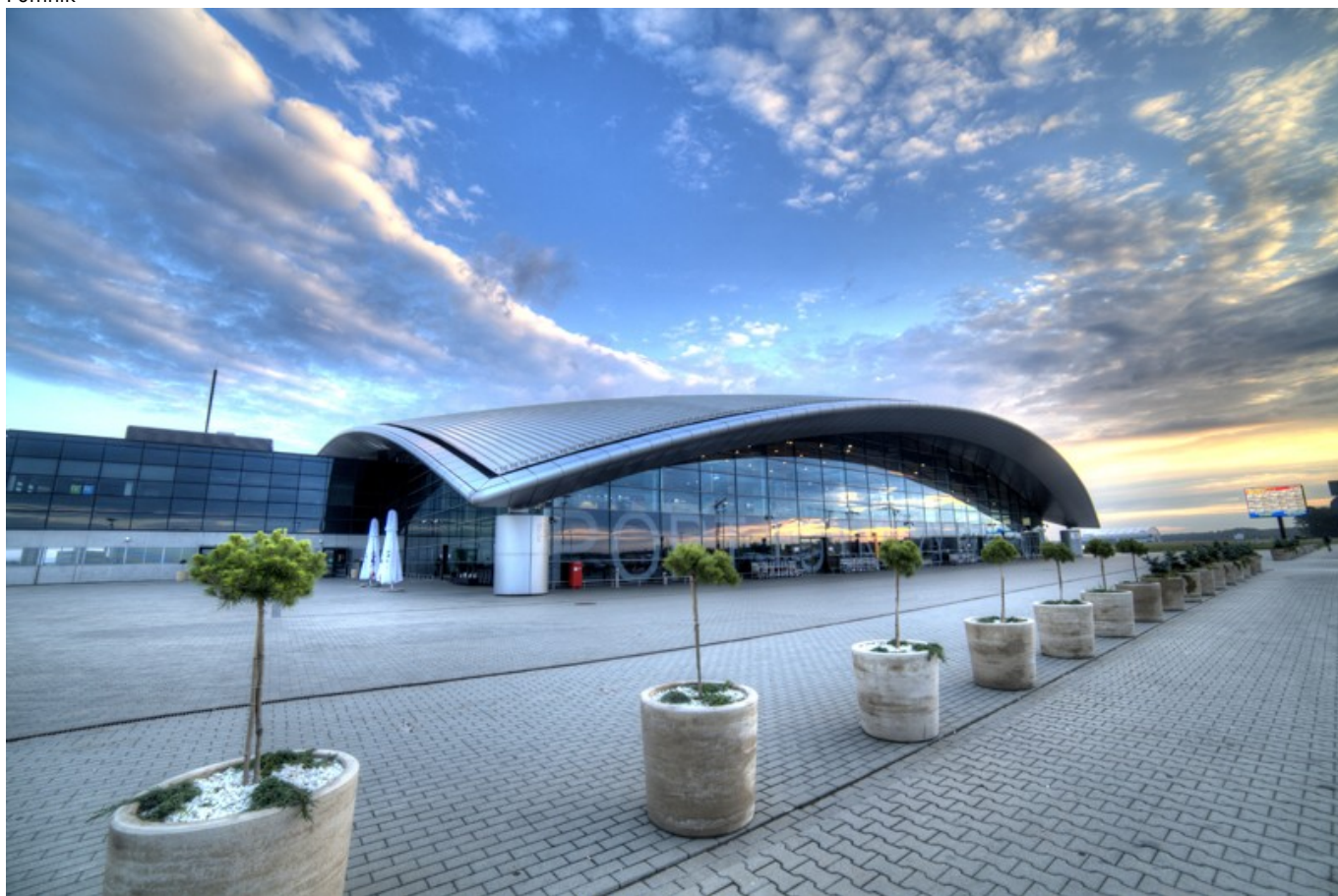
Port lotniczy Rzeszów - Jasionka