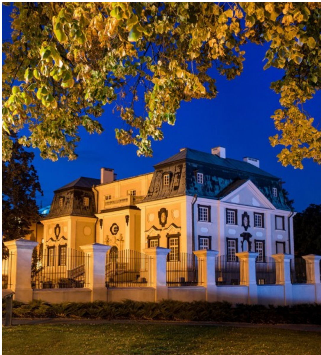
Letni pałacyk Lubomirskich