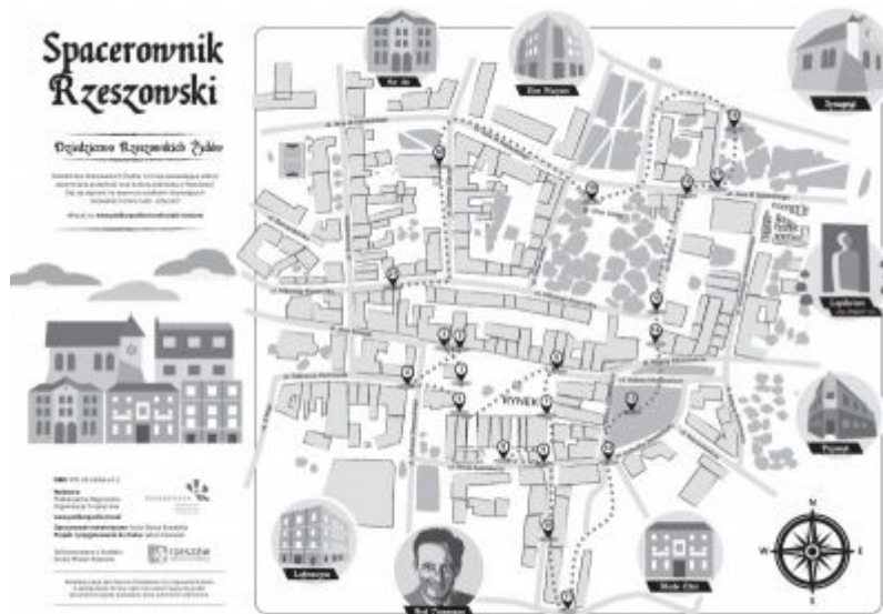
Ulotka Spacerownika Rzeszowskiego