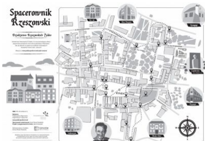
Ulotka Spacerownika Rzeszowskiego