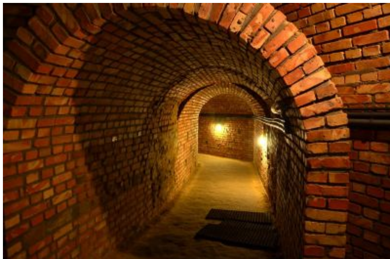
Podziemna Trasa Turystyczna pod Rynkiem Starego Miasta w Rzeszowie