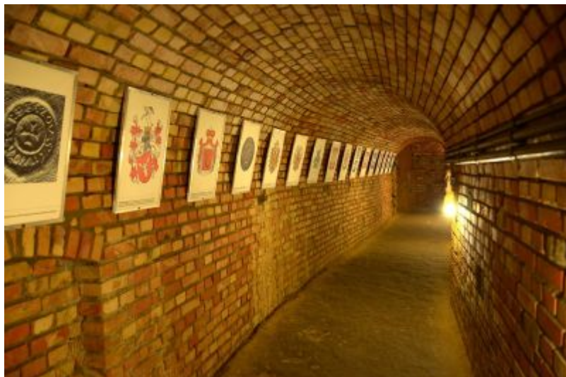
Podziemna Trasa Turystyczna pod Rynkiem Starego Miasta w Rzeszowie