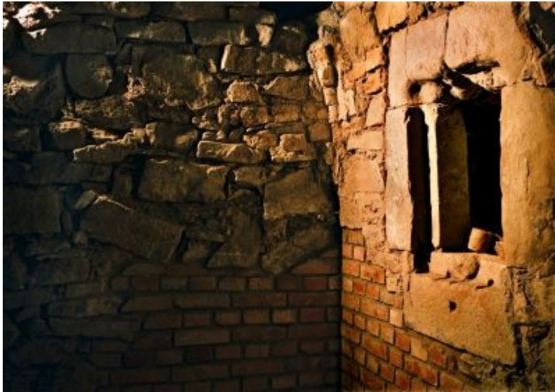
Podziemna Trasa Turystyczna pod Rynkiem Starego Miasta w Rzeszowie