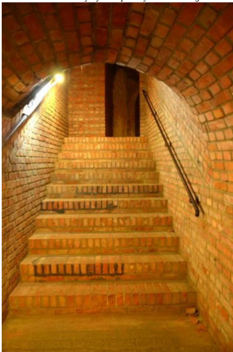
Podziemna Trasa Turystyczna pod Rynkiem Starego Miasta w Rzeszowie