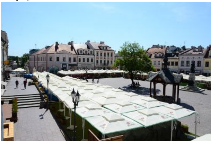
Stary Rynek w Rzeszowie