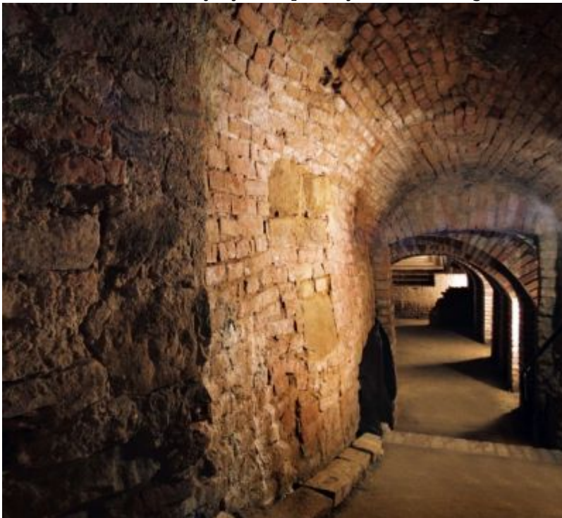
Podziemna Trasa Turystyczna pod Rynkiem Starego Miasta w Rzeszowie