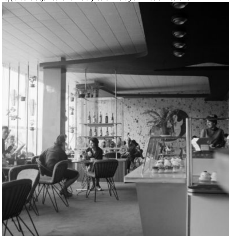
Wnętrze kawiarni "Kosmos". Zbiory Galerii Fotografii Miasta Rzeszowa

Dom Towarowy "Delikatesy" z kawiarnią "Kosmos". Budynek po przebudowie z lat 1960-1961. Miejsce narożnej niszy z figurą Matki Bożej zajęła dekoracja neonowa. Zbiory Galerii Fotografii Miasta Rzeszowa