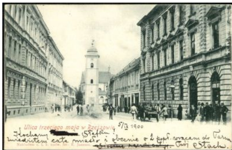
Budynek Komunalnej Kasy Oszczędności z lat 1890-1892 na pocztówce z 1900 r.