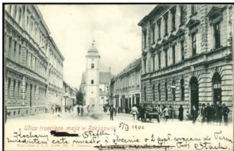
Budynek Komunalnej Kasy Oszczędności z lat 1890-1892 na pocztówce z 1900 r.