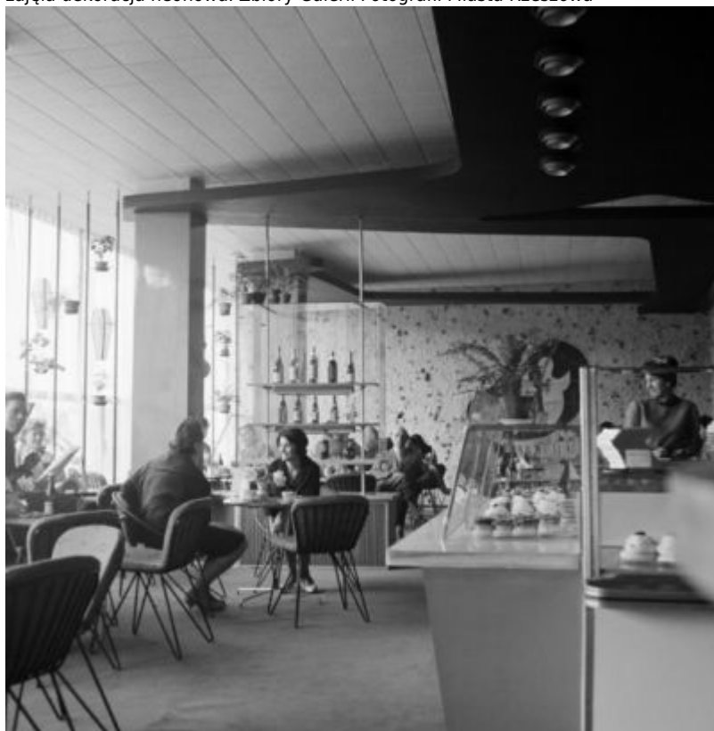
Wnętrze kawiarni "Kosmos". Zbiory Galerii Fotografii Miasta Rzeszowa

Dom Towarowy "Delikatesy" z kawiarnią "Kosmos". Budynek po przebudowie z lat 1960-1961. Miejsce narożnej niszy z figurą Matki Bożej zajęła dekoracja neonowa. Zbiory Galerii Fotografii Miasta Rzeszowa