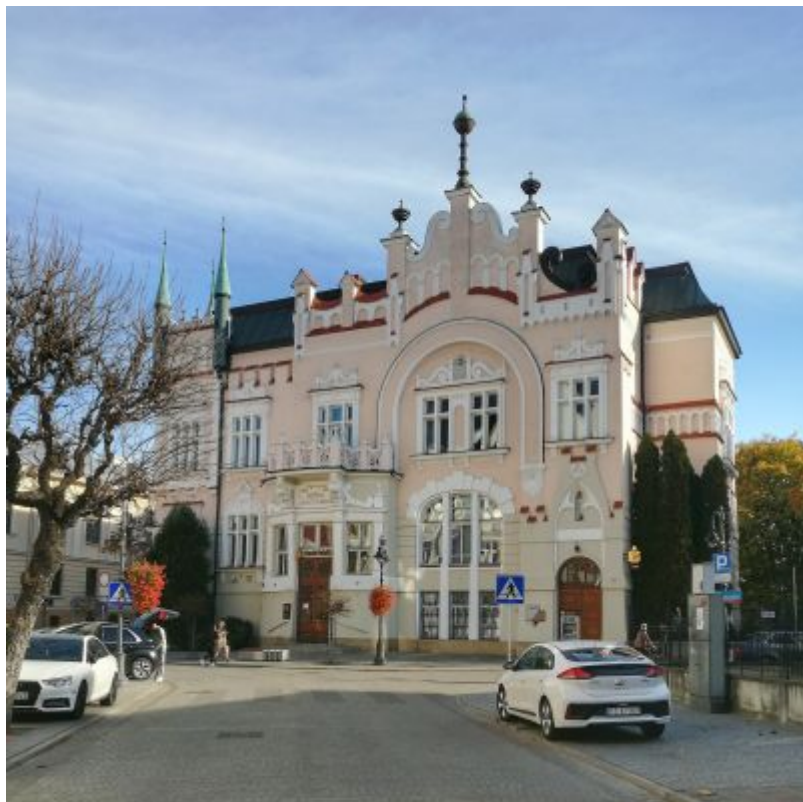
Jan Peroś, gmach Kasy Oszczędności przy ul. 3 Maja 23 z 1907 r., obecna siedziba Banku Polskiego Pekao.