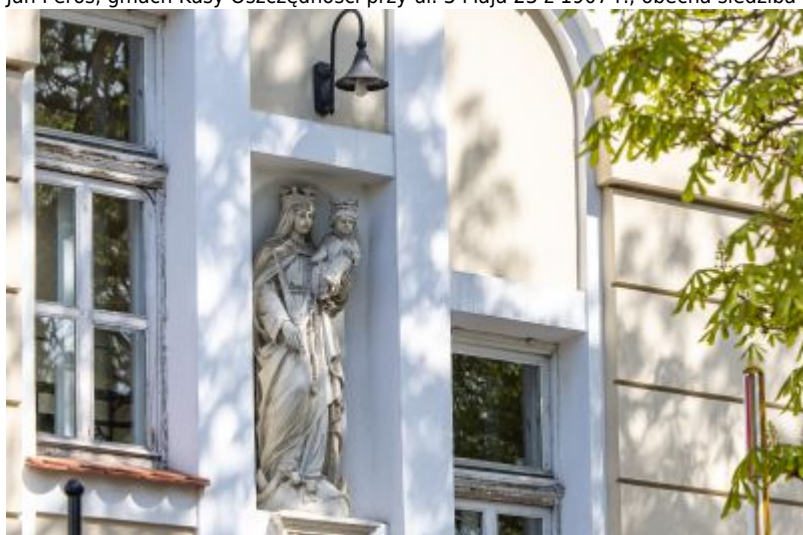
Figura Matki Bożej z narożnej niszy Komunalnej Kasy Oszczędności przeniesiona na elewacją południową nowego gmachu przy ul. 3 Maja 23.