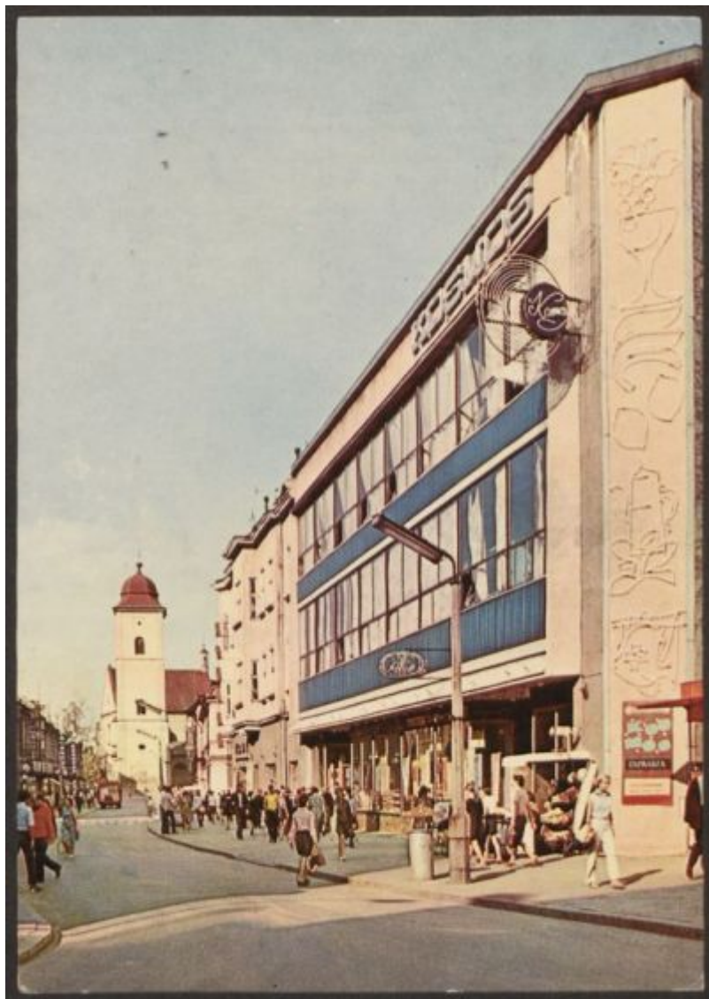
Dom Towarowy "Delikatesy" z kawiarnią "Kosmos". Budynek po przebudowie z lat 1960-1961. Miejsce narożnej niszy z figurą Matki Bożej zajęła dekoracja neonowa.