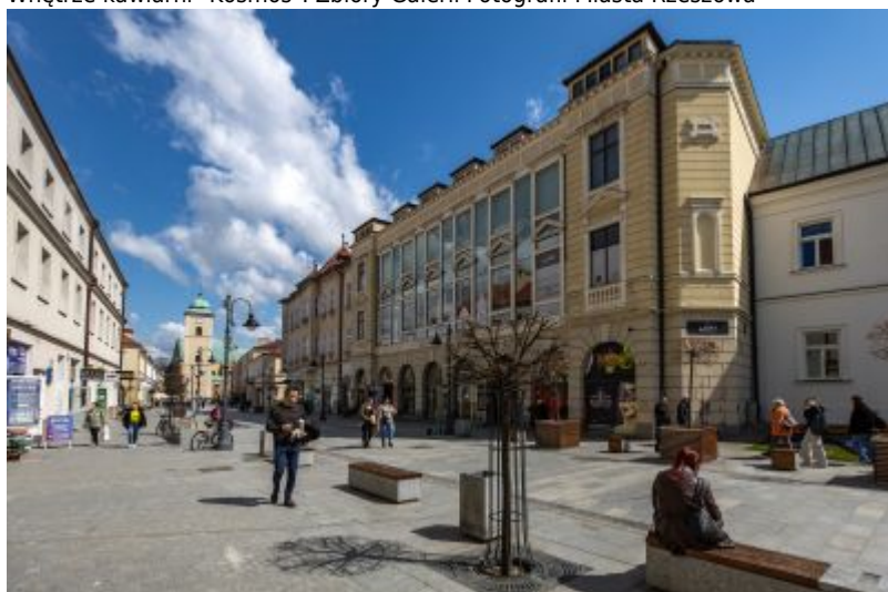
Budynek przy ul. 3 Maja 13 współcześnie po przebudowie z 2002 r.