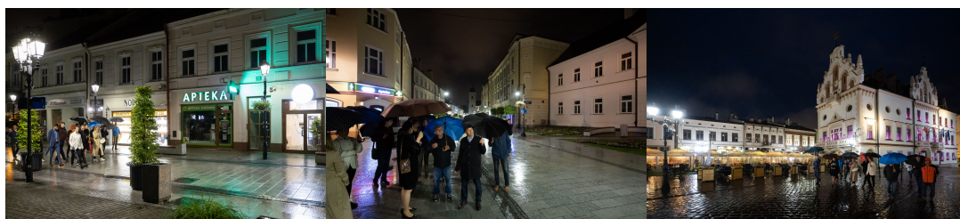
Spacer konsultacyjny z mieszkańcami