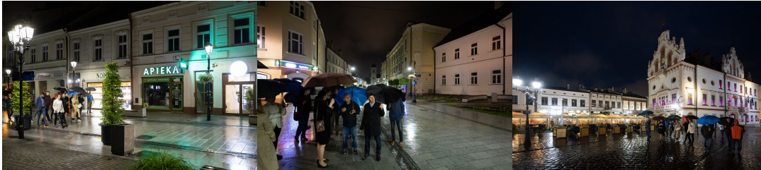
Spacer konsultacyjny z mieszkańcami