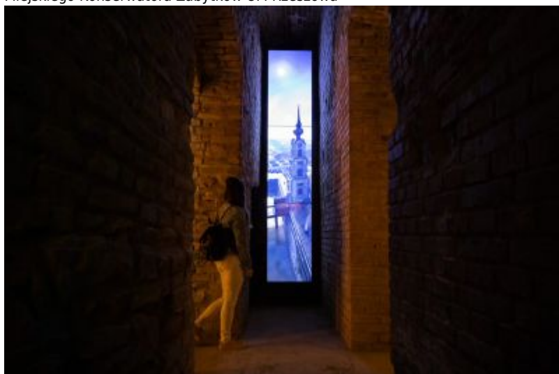
Widok współczesny. Ulokowana pod płytą Rynku miejska interaktywna instytucja kultury pn. "Rzeszowski Piwnice?".