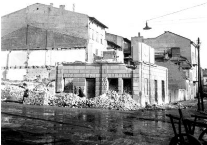
Rok 1941: na skutek zawalenia piwnic dokonano rozbiórki kamienic w pierzei południowej Rynku. Widok od strony ul. Króla Kazimierza (dzisiejszy parking pod Ratuszem). Fotografia z czasów okupacji ze zbiorów Galerii Fotografii Miasta Rzeszowa