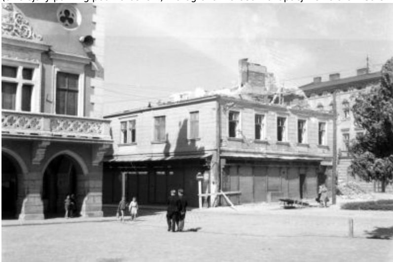
Rok 1942: rozbiórka kwartału w pierzei zachodniej Rynku. W ich miejscu mieści się dzisiaj budynek wejścia do "Rzeszowskich Piwnic". Fotografia z czasów okupacji ze zbiorów Galerii Fotografii Miasta Rzeszowa