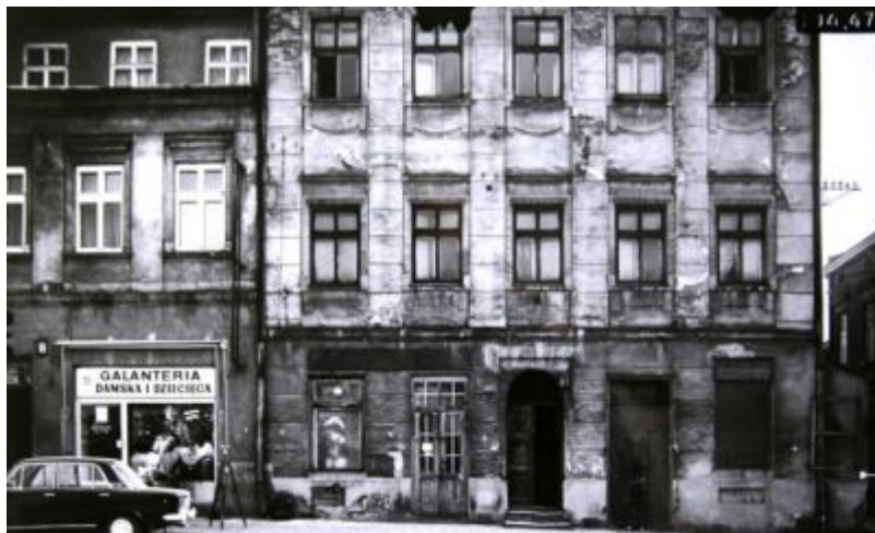
Stan zabudowy rynkowej pod koniec lat 60. XX w. Fotografia ze zbiorów Biura Miejskiego Konserwatora Zabytków UM Rzeszowa