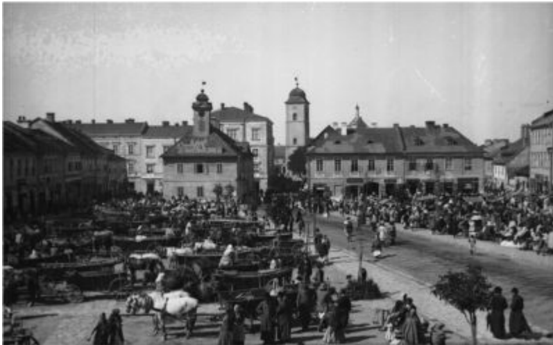
Jarmark na rzeszowskim Rynku. Fotografia Edwarda Janusza z lat 90-tych XIX w. Zbiory Galerii Fotografii Miasta Rzeszowa