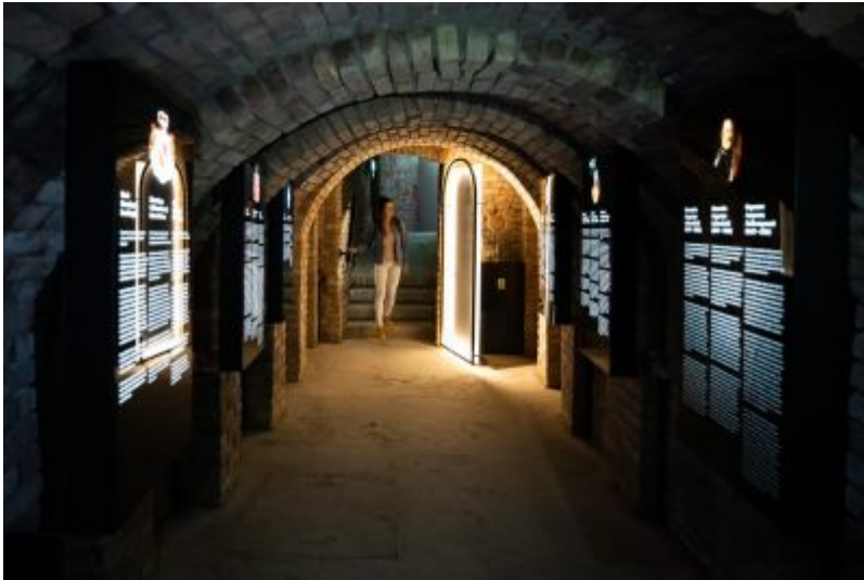
Widok współczesny. Ulokowana pod płytą Rynku miejska interaktywna instytucja kultury pn. "Rzeszowski Piwnice".