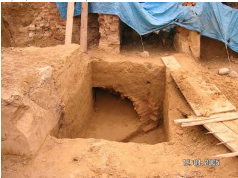
Odkryte w pierzei zachodniej fragmenty piwnic i sklepień będące pozostałościami zabudowy wyburzonej przez Niemców podczas II wojny światowej.