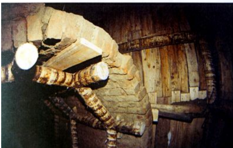
Lata 80. XX w.: zdjęcia ilustrujące akcję ratunkową zabezpieczania podziemnych wyrobisk pod płytą Rynku.