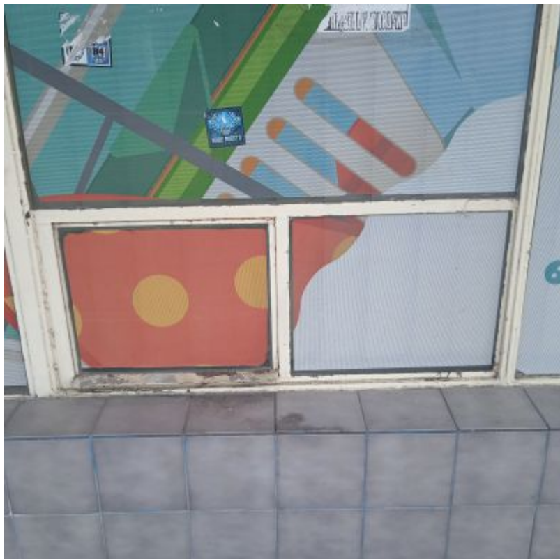
Pawilon przy ul. Hetmańskiej 35. Zachowane małe okienko służące dawniej do wydawania produktów lub sprzedaży.