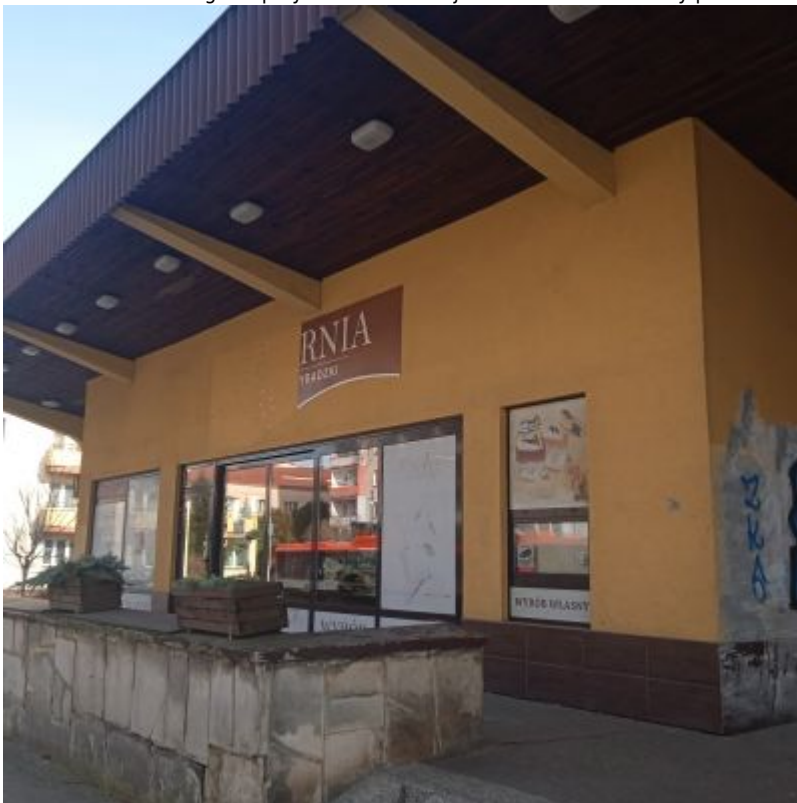
Pawilon przy ul. Hetmańskiej 25, powstały wtórnie, najprawdopodobniej w latach 90. XX wieku, w wyniku zabudowania trzech z pięciu filarów poprzedzających pierwszy pawilon od strony północno-wschodniej. Przed pawilonem widoczny zachowany niski mурowany murek w kształcie litery 'L', z dłuższym bokiem równoległym do ulicy, z obrzutką cementową o wydatnych, profilowanych spoinach, imitującą nieregularny łamany kamień.