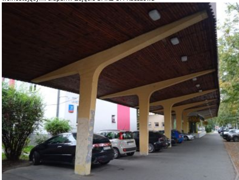
Podcień między pawilonem Hetmańska 35 i 39 oparty jest na pięciu słupach. Prefabrykowane słupy charakteryzuje sugestywny, dynamiczny kształt stylizowanej litery 'T' z dużym wysięgiem wsporników o jednokierunkowym płaskim spadku. Słupy ustawione są tu rytmicznie w równych odstępach.