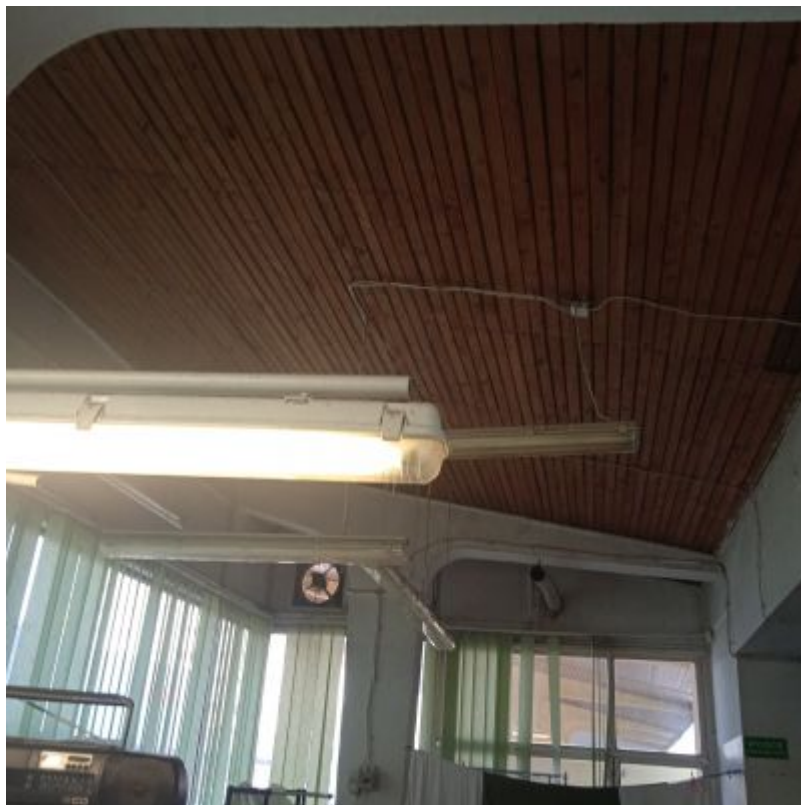
Pawilon przy ul. Hetmańskiej 35. Wnętrze lokalu usługowego z zachowanym odstępnym zadaszeniem z drewnianą boazerią oraz czterema wolnostojącymi słupami.