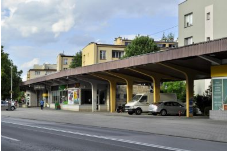
Wiata handlowo-usługowa przy ul. Hetmańskiej 25-39. Widok od strony południowo-zachodniej.