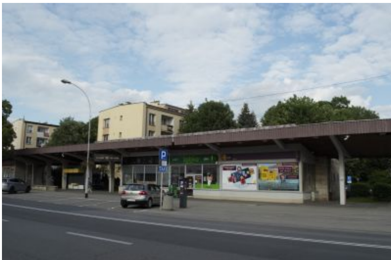
Pawilon przy ul. Hetmańskiej 31, przekształcony. Oryginalne przeszklenie elewacji zostało zlikwidowane i zastąpione oknami z PCV, powielającymi historyczny pas przeszklonej płaszczyzny, tworzonej przez prostokątne kwatery. Ściany pawilonu są otynkowane a cokół obłożony płytkami ceramicznymi.