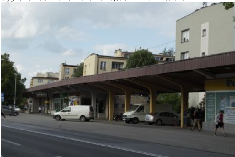
Podcień między pawilonami Hetmańska 31 i 35, oparty na pięciu słupach, ustawionych rytmicznie w równych odstępach.