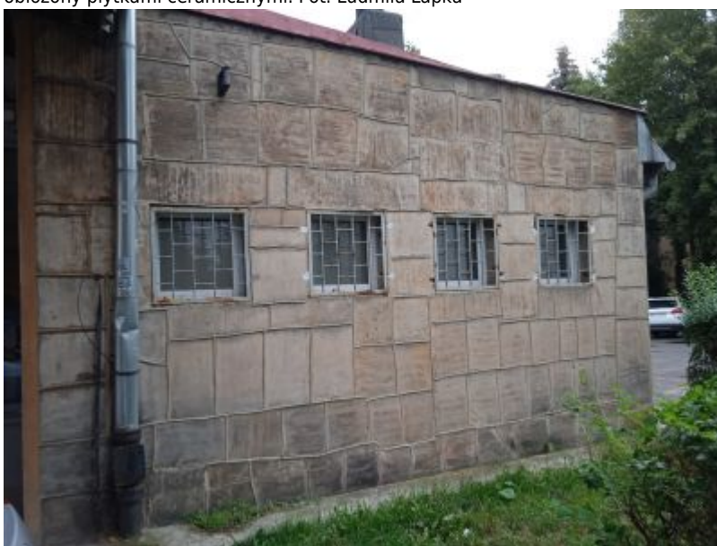
Południowa ściana zalepca pawilonu przy ul. Hetmańskiej 31 zachowuje dekoracyjną okładzinę cementową z wydatnymi spoinami oraz oryginalne metalowe kratki okienne.