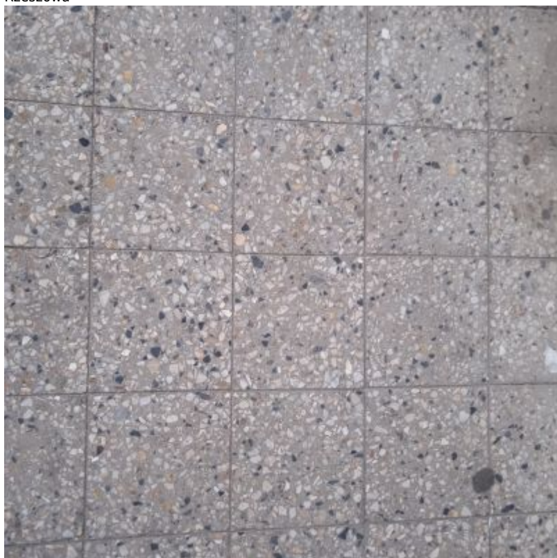
Pawilon przy ul. Hetmańskiej 35. Zachowane płytki z lastriko na podeście przy wejściu do pawilonu od strony południowej.