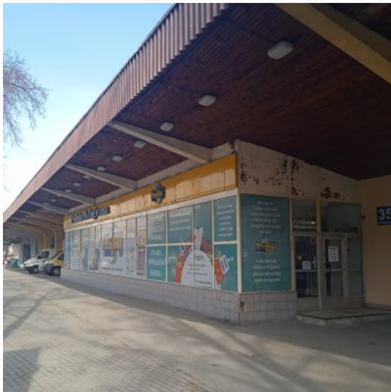
Pawilon przy ul. Hetmańskiej 35 w największej części prezentuje oryginalny wystrój i wyposażenie pawilonu. Zachowany jest tu oryginalny środkowy pas przeszklecia elewacji ze stalową stolarką w kształcie prostokątnych kwadratów w układzie leżącym i stojącym, tworzących geometryczną kompozycję.