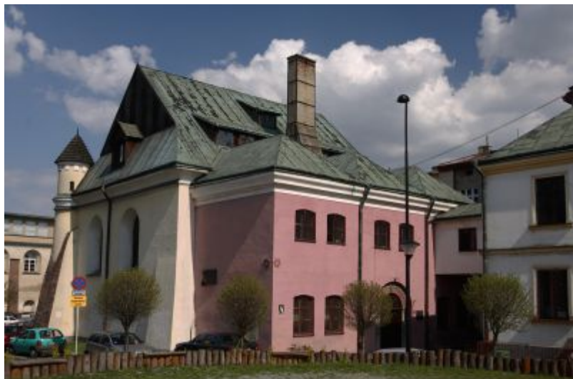
Synagoga Staromiejska, fot. Tadeusz Poźniak