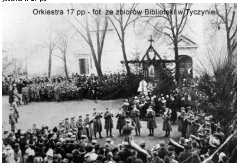
Orkiestra 17 pp