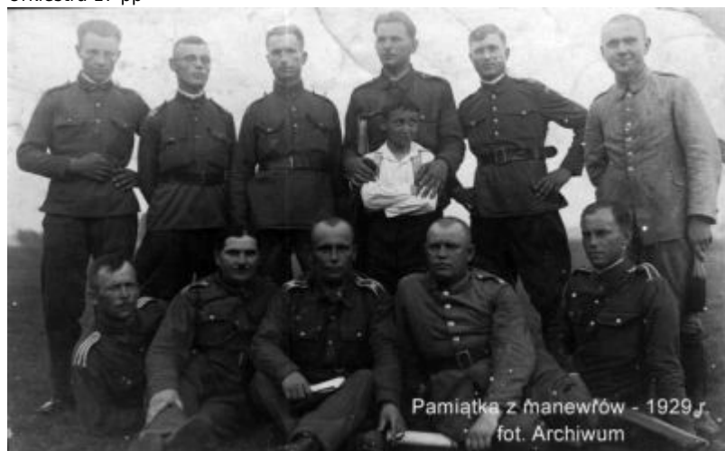
Pamiętkowe zdjęcie z manewrów w 1929 r.