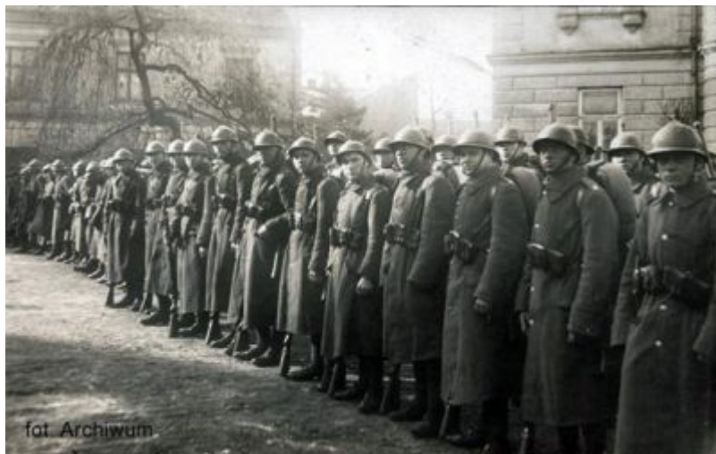
Żołnierze 17 pp