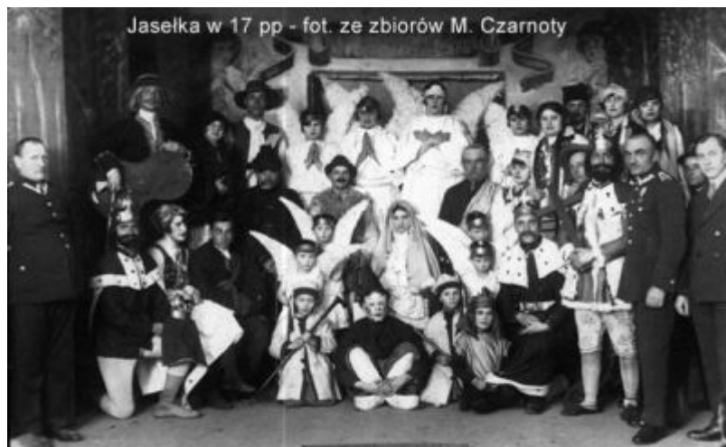
Jasełka w 17 pp