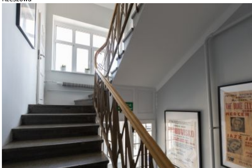
Wnętrze klatki schodowej willi Fryderyka Janusza. Usytuowana po północno-wschodniej stronie domu, tj. poza obrębem części dziennej, komunikowała parter z piętrem w taki sposób, że obydwa poziomy mogły funkcjonować w sposób od siebie niezależny. Zastosowana tu powtarzalność rozwiązań była również bardzo nowoczesna.