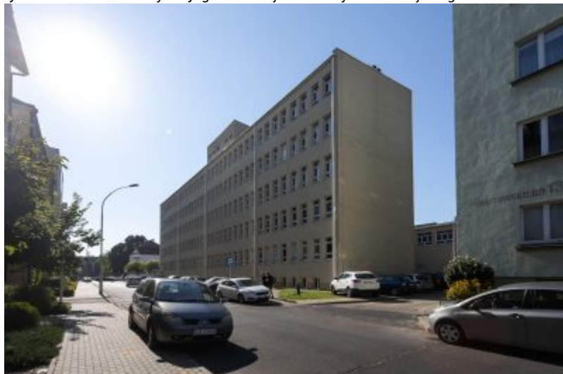
W miejscu rozebranej w latach 70. XX wieku "Janusówki" stoi dziś skrzydło Przychodni Specjalistycznej Nr 3 przy ul. Hoffmanowej 8a.