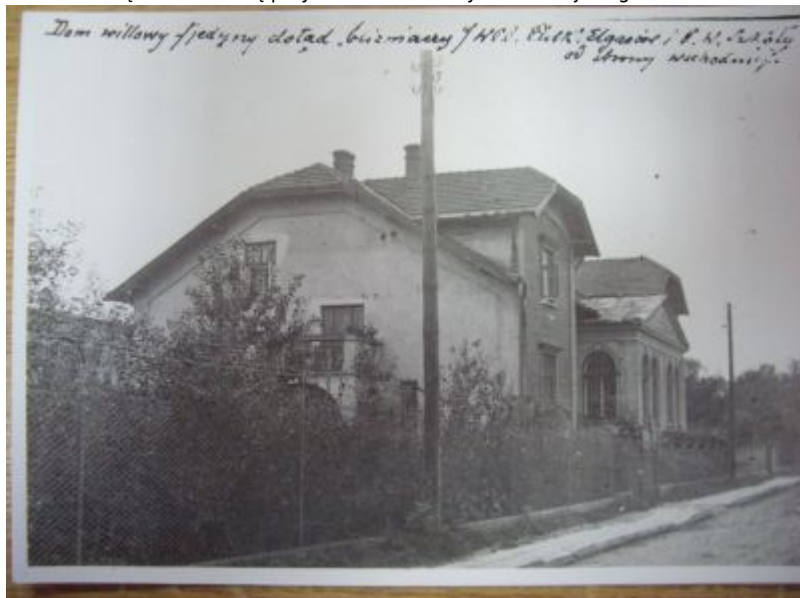
"Janusówka" od strony ul. Jagiellońskiej.