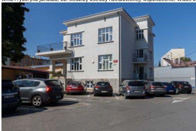
Willa Fryderyka Janusza, ob. siedziby Estrady Rzeszowskiej, współcześnie. Widok od strony południowo-wschodniej.