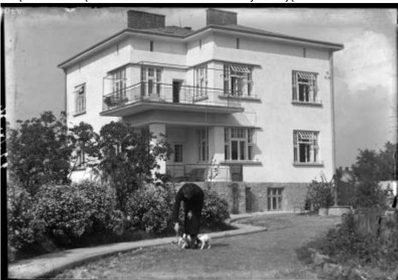
Ukończony dom Fryderyka Janusza na archiwalnej fotografii rodzinnej. Zdjęcie wykonane od strony południowej ukazuje eksponowane na słońce elewacje południowo-wschodnią i południowo-zachodnią, powiązane obszernym narożnym podcieniem na parterze i usytuowanym nad nim tarasem. Świadome projektowanie pokoi dziennych po najbardziej nasłonecznionej stronie oraz wiązanie mieszkania z naturalnym