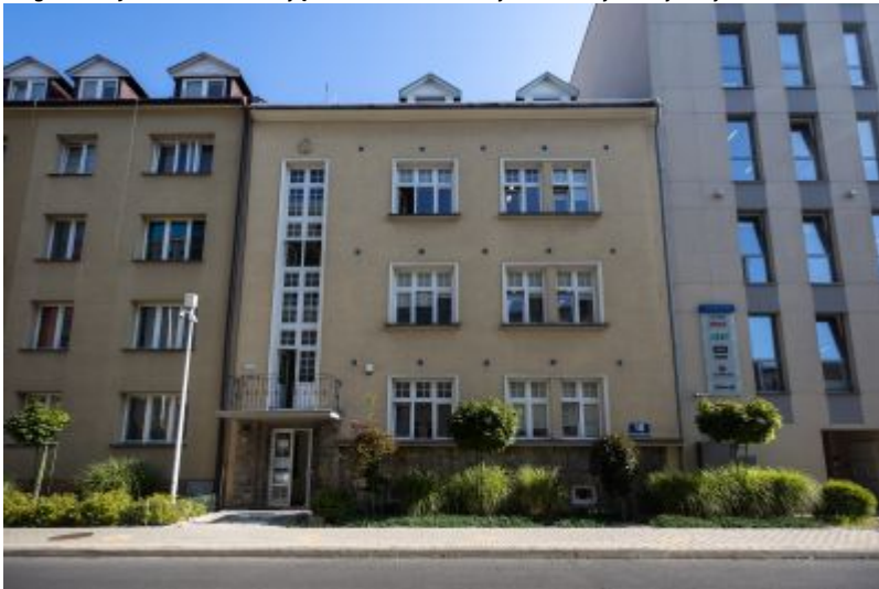
Zmodernizowana kamienica przy ul. Poniatowskiego 10 współcześnie.

Czy wiesz, że ... domów należących do rodziny Edwarda Janusza, wybitnego fotoreportera codzienności rzeszowian w dobie autonomii galicyjskiej, było aż trzy? Pierwszy został wyburzony, kolejny przekształcony i dziś tylko jedna z dawnych posiadłości Januszy zachowuje pamięć o tej zasłużonej dla miasta rodzinie, jak również kontynuuje kulturalną tradycję miejsca, które przez kilka dziesięcioleci żyło jej obecnością.