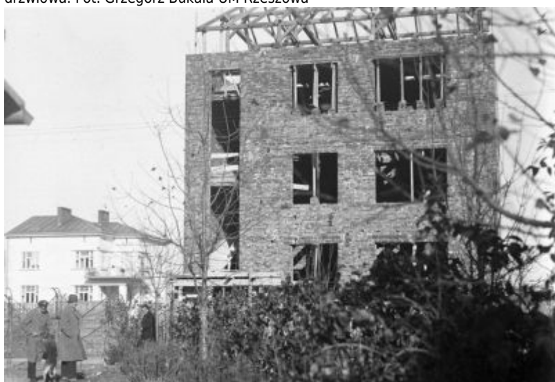
Fotografia z rodzinnego archiwum ukazująca budowę trzeciego z kolei domu Januszy, tj. modernistycznej kamienicy przy ul. Poniatowskiego 10. Zwraca uwagę, że nowy dom został wybudowany w granicy posesji należącej do willi Fryderyka, którą widzimy w tle. Zdjęcie ze zbiorów Galerii Fotografii Miasta Rzeszowa