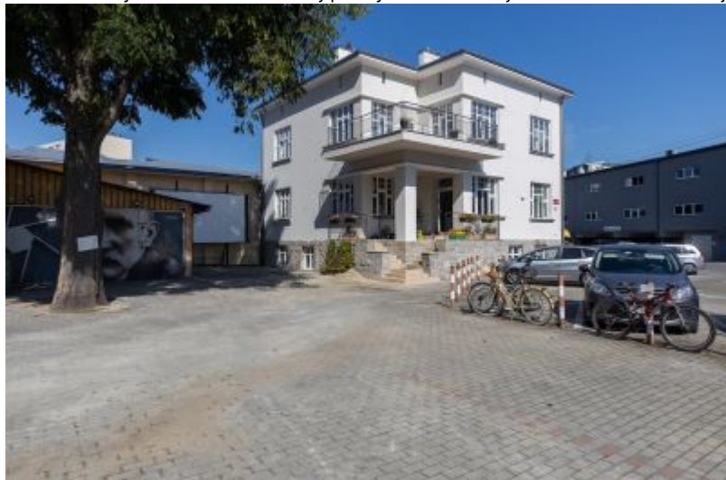
Willa Fryderyka Janusza, ob. siedziby Estrady Rzeszowskiej, współcześnie. Widok od strony południowej.

otoczeniem było wówczas w lokalnej praktyce budowlanej bardzo nowatorskie.