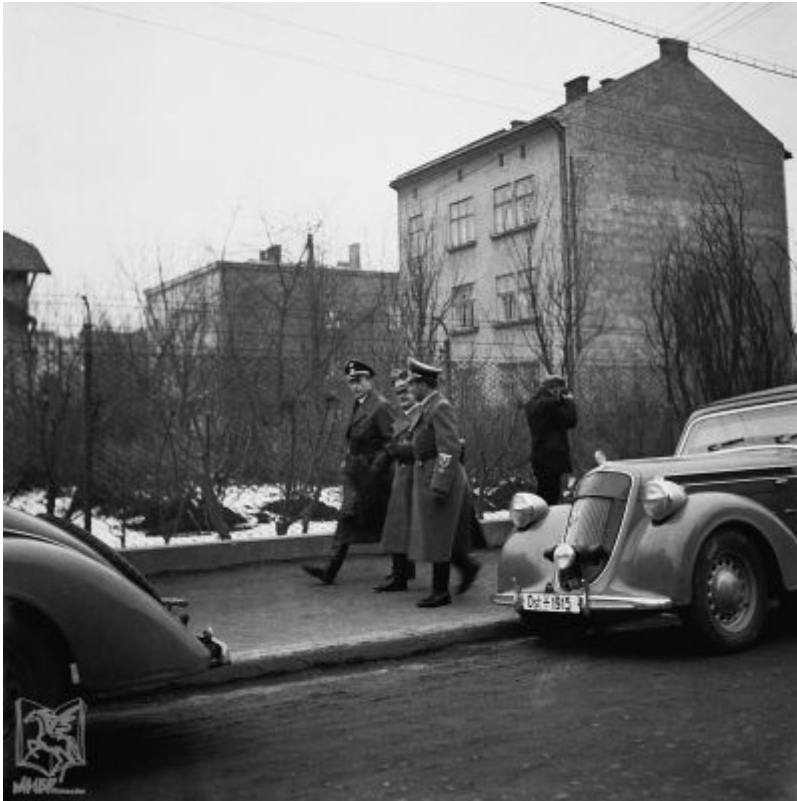
Fotografia z czasów drugiej wojny światowej przedstawiająca w tle ukończoną już kamienicę przy ul. Poniatowskiego 10 oraz po lewej stronie fragment ?Januszkówki?.